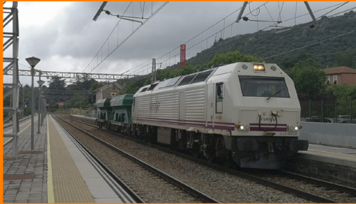
Locomotora 333.4 en decoración "Renfe Operadora" con un traslado de dos tolvas de balasto entre Collado Mediano, donde se quedaron por avería, y Vicalvaro Clasificación (Junio-2021)