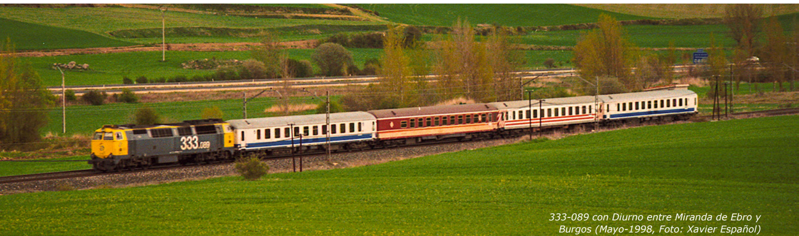
333-089 con Diurno entre Miranda de Ebro y Burgos (Mayo-1998)