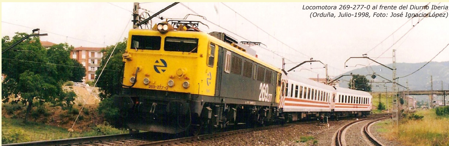
Locomotora 269-277-0 al frente del Diurno Iberia (Orduña, Julio-1998,)