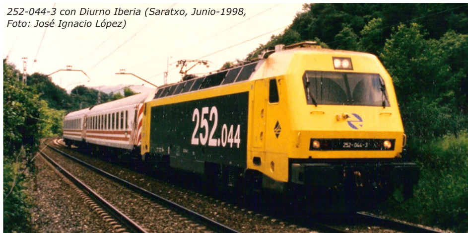
252-044-3 con Diurno Iberia (Saratxo, Junio-1998,)

Foto drch. 333-034 al frente de un Diurno procedente de Salamanca en las proximidades de Burgos (Julio-1998,)