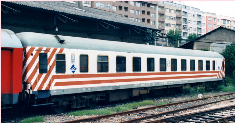
Coche B11tr-16.207 (Estación de A Coruña-San Cristóbal, Agosto-1997)

Por otro lado, estos coches ya llevaban a sus espaldas bastantes kilómetros desde que fueron transformados de BB-8.500 a B11tr-16.200 en los Talleres de Málaga-Los Prados en los años 1991-1992. De ahí que el tono gris de techo y bastidor acusaban el paso del tiempo, habiéndose tornado a un gris mucho más claro. Este hecho no afectó tanto al tono naranja de las rayas.