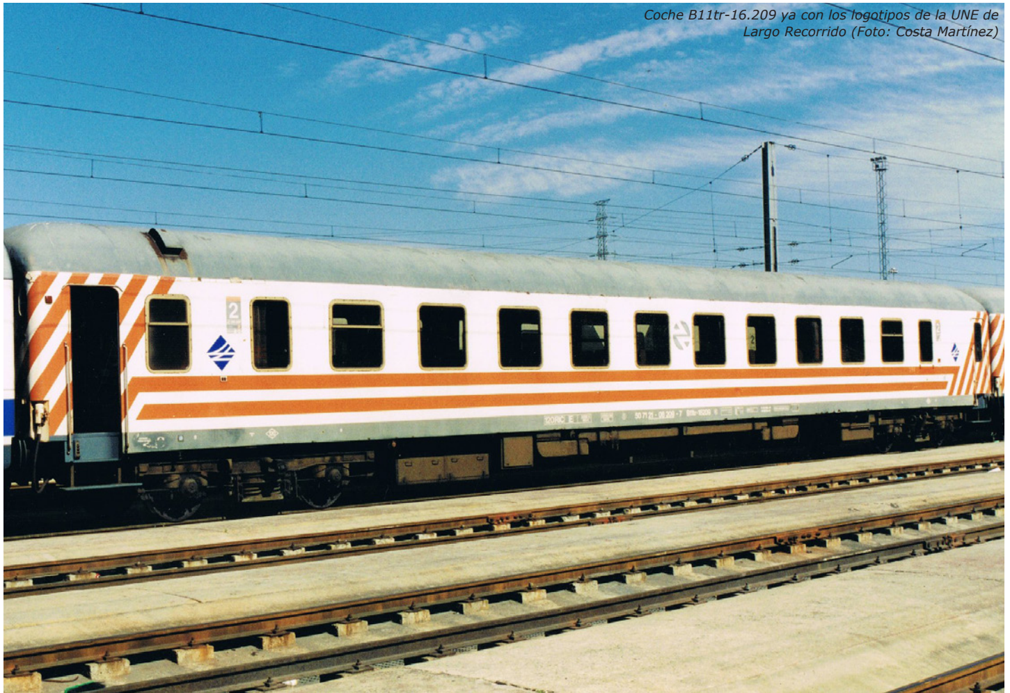
Coche B11tr-16.209 ya con los logotipos de la UNE de Largo Recorrido