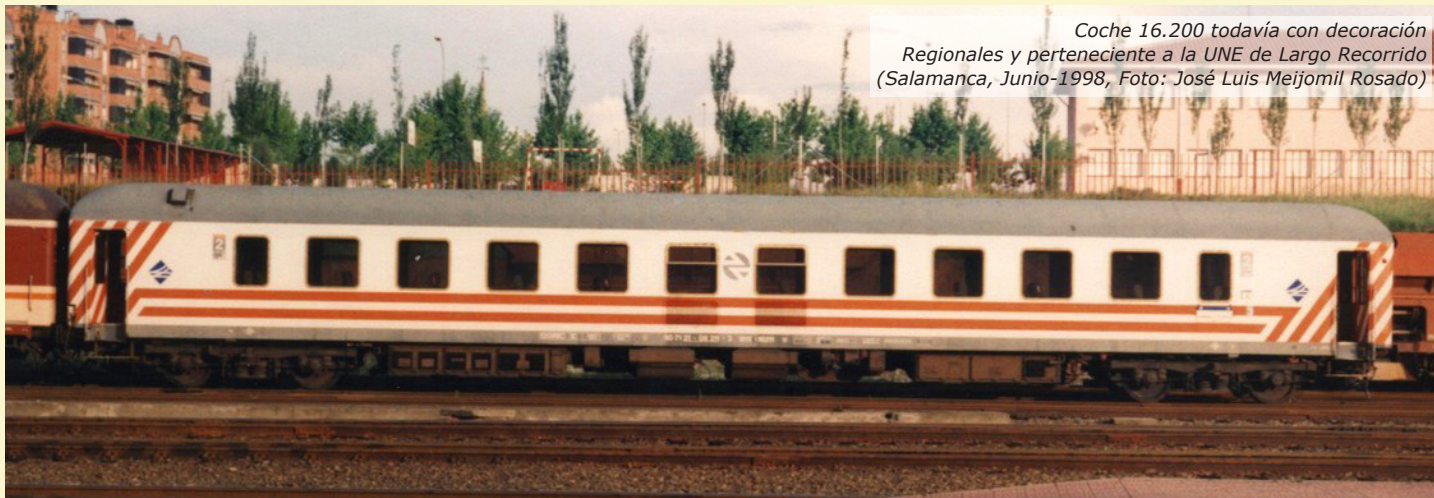
Coche 16.200 todavía con decoración Regionales y perteneciente a la UNE de Largo Recorrido (Salamanca, Junio-1998, Foto: José Luis Meijomil Rosado)

Igualmente, en el anterior artículo se comentó que estos coches todavía con decoración blanca-naranja de Regionales mantuvieron durante un largo período de tiempo la letra "r" en su matrícula pese a pertenecer ya a la UNE de Largo Recorrido y denominárseles de forma oficial como B11t-16.200. Recordemos que los decorados con librea "Danone" perdían dicha letra en la matrícula al ser pintados en esos colores, con la excepción del coche B11tr-16.201 que, por ser el primero, se decidió conservar la letra "r" por un breve