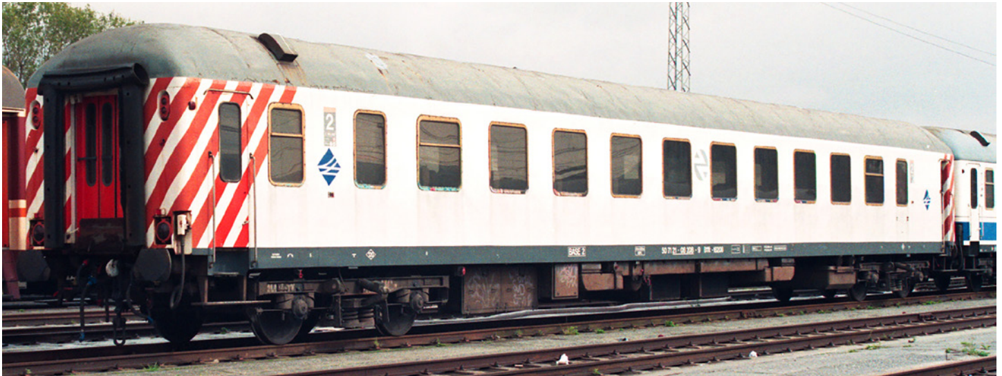
Foto inferior. Coche B11t-16.208 en colores "transición" (Irún, Mayo-1998)

Intento, además, bastante económico ya que únicamente se eliminaron las franjas naranjas longitudinales de la zona principal del lateral de la carrocería, quizás en previsión ya de la corta vida que les quedaba a estos coches todavía con bogies Minden-Deutz.