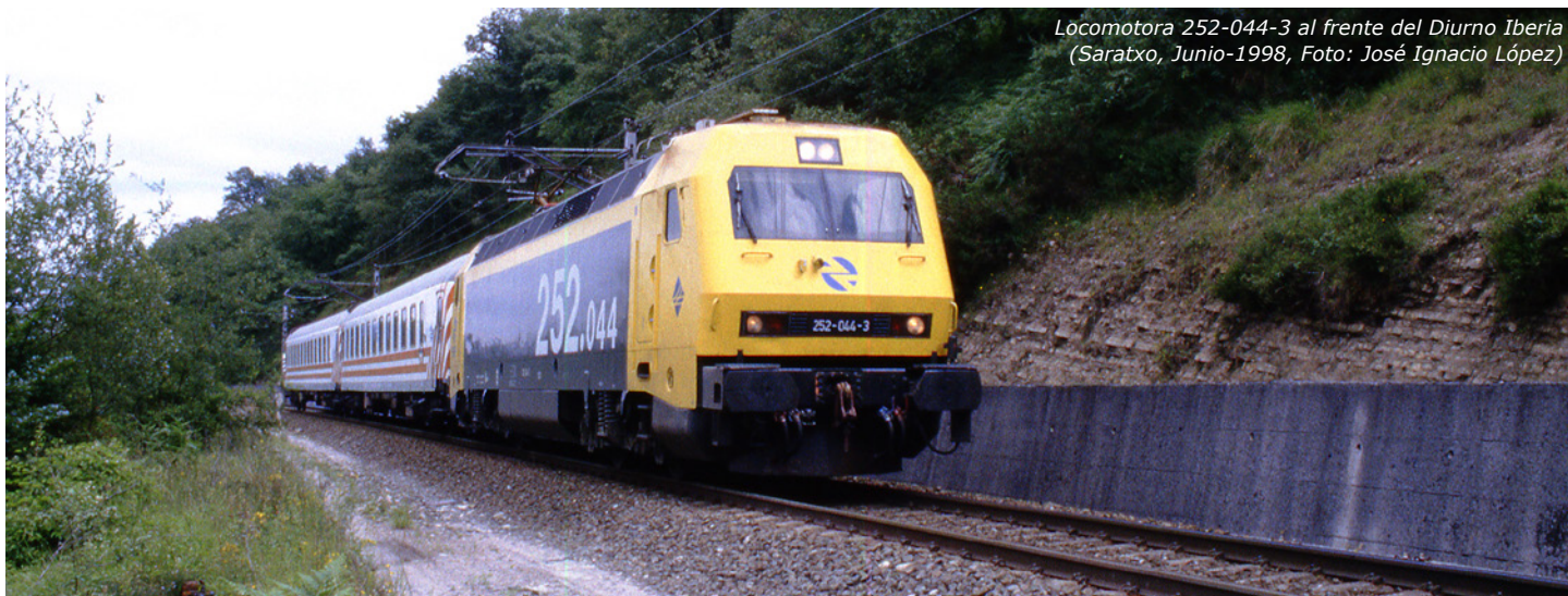
Locomotora 252-044-3 al frente del Diurno Iberia (Saratxo, Junio-1998,)