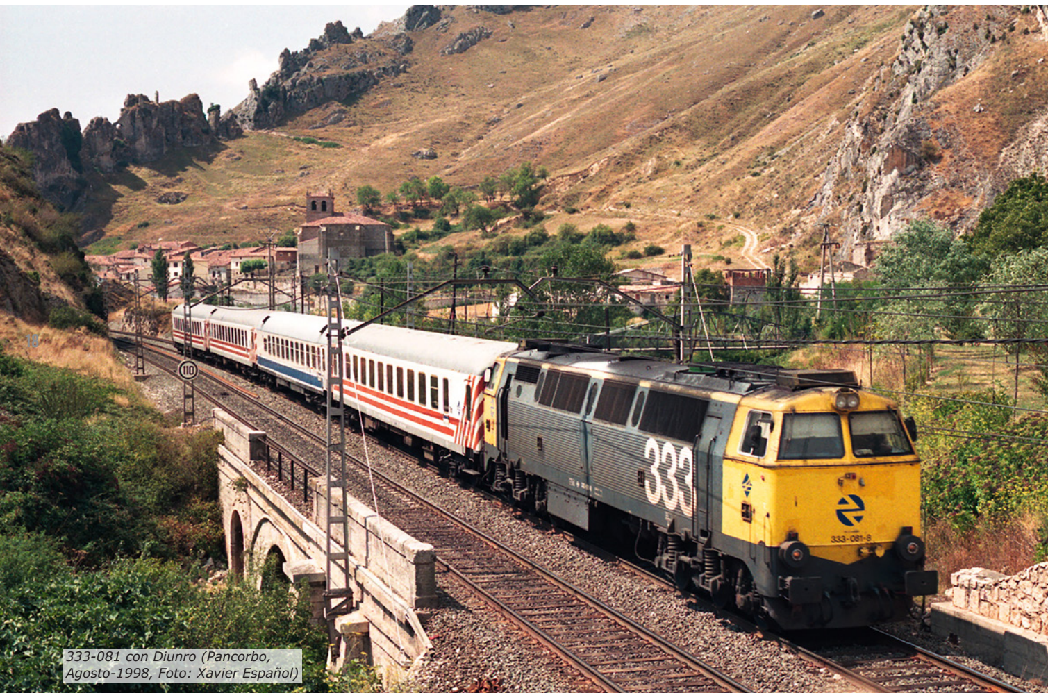
333-081 con Diunro (Pancorbo, Agosto-1998)