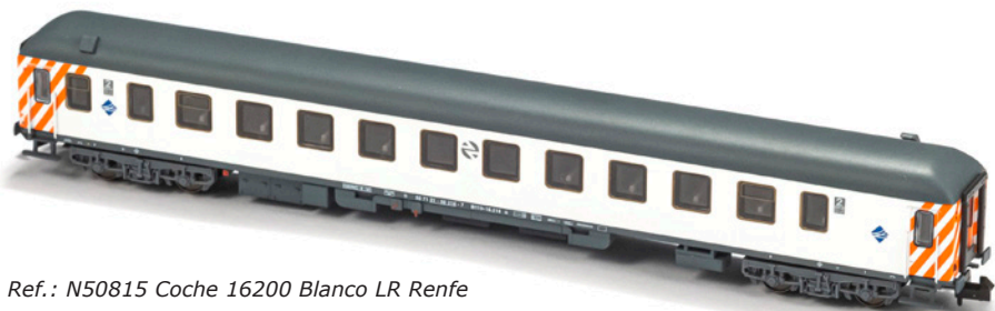
Ref.: N50815 Coche 16200 Blanco LR Renfe

Uno de estos coches sin franjas naranjas longitudinales y bogies minden de Largo Recorrido, en concreto el 16.214, compone a escala 1:160 nuestra referencia MFTrain N50815.