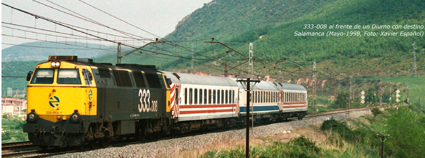
333-008 al frente de un Diurno con destino Salamanca (Mayo-1998)