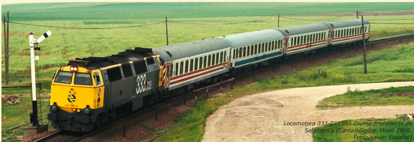
Locomotora 333-035 con Diurno procedente de Salamanca (Cantalapiedra, Mayo-1998)