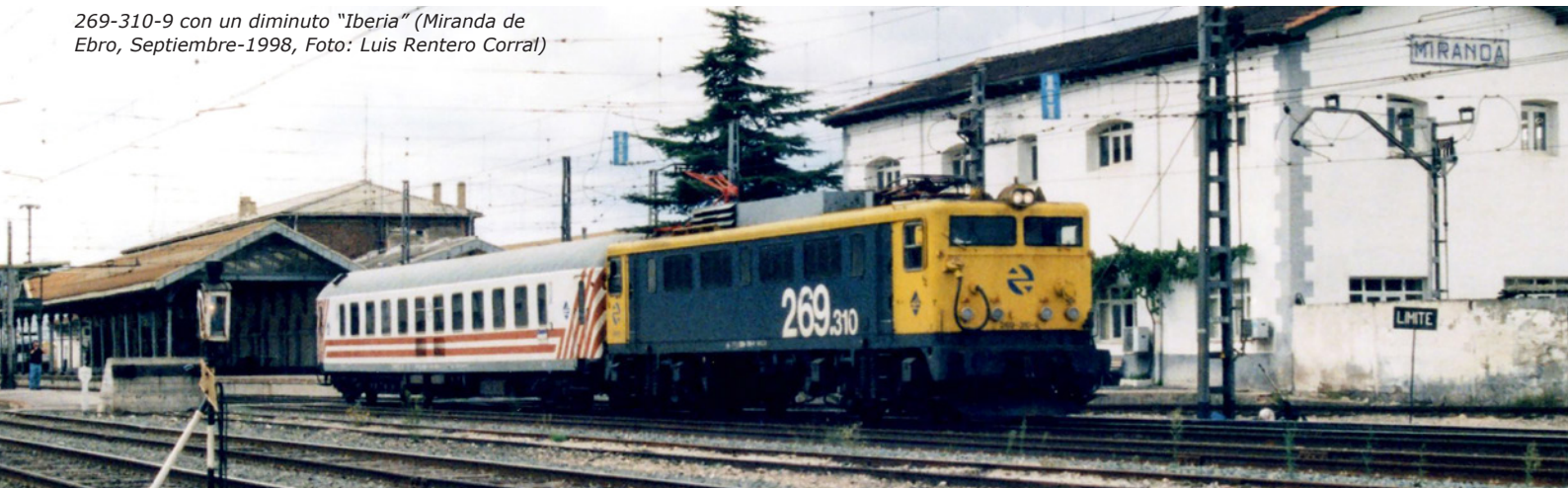
269-310-9 con un diminuto "Iberia" (Miranda de Ebro, Septiembre-1998,)