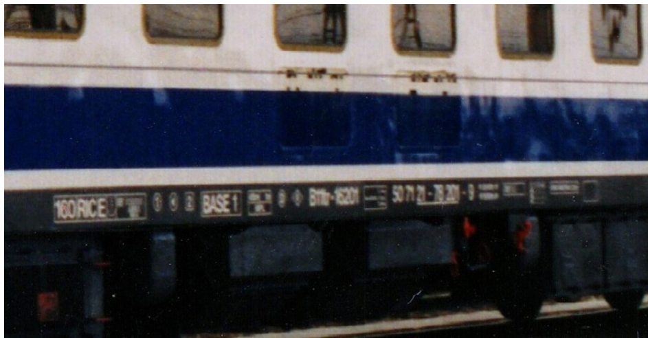
Foto superior. Coche B11tr-16.201 todavía con la letra "r" en su matrícula (Madrid-Fuencarral, Marzo-1995, Foto: Luis Rentero Corral)