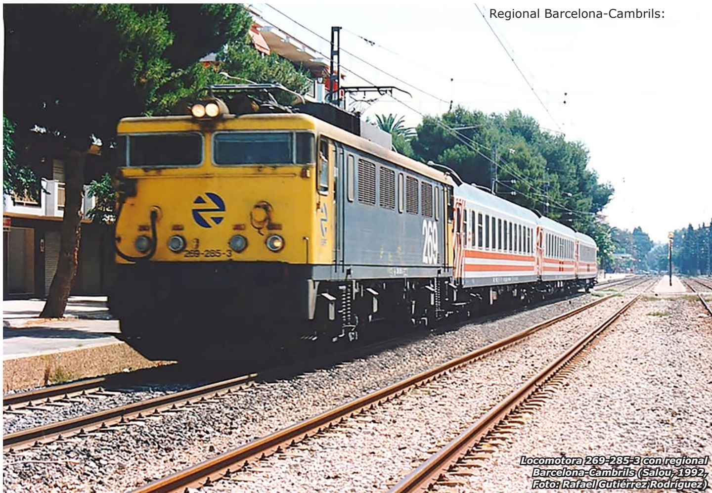
Locomotora 269-285-3 con regional Barcelona-Cambrils (Salou, 1992,)