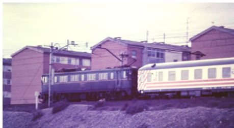
Locomotora Mitsubishi de la serie 269 con regional Madrid-Almuradiel (Madrid-San Cristóbal de los Ángeles, 1992)