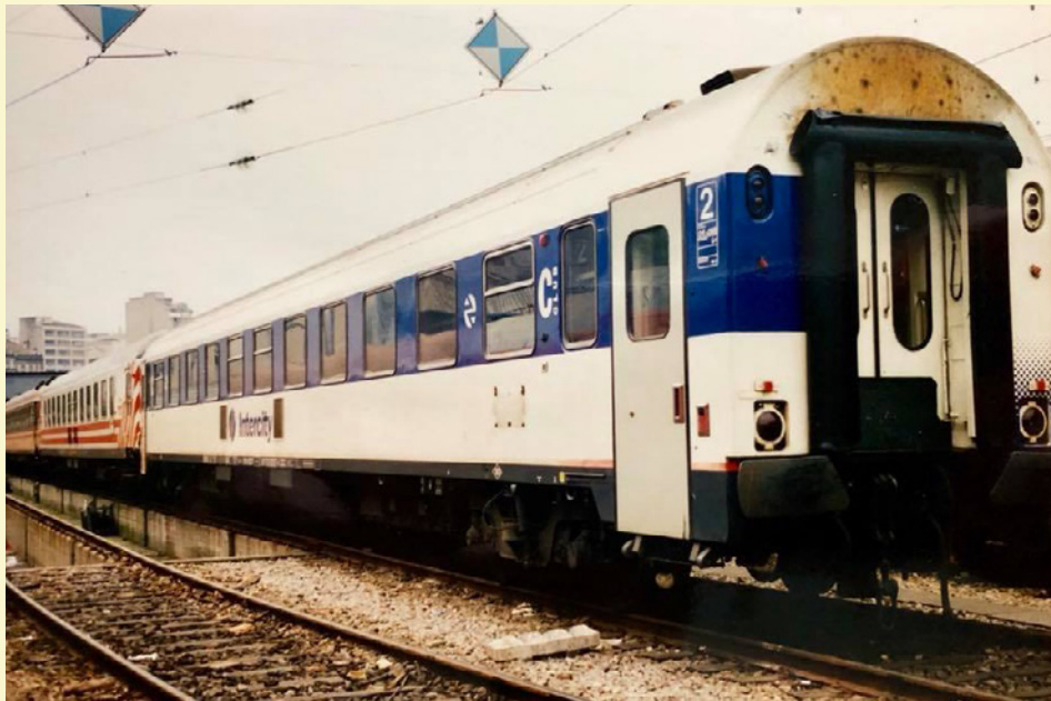
Foto derecha: Coche prototipo sin fuelles en los testeros ni inscripciones

B11x-10.217 con prueba de pintura "Intercity" (Vigo, Abril-1993)