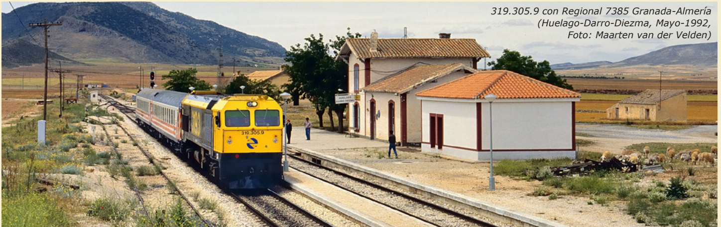
319.305.9 con Regional 7385 Granada-Almería (Huelago-Darro-Diezma, Mayo-1992,)