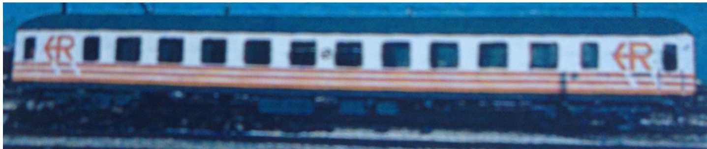
Lateral del coche prototipo con la decoración que finalmente no prosperó