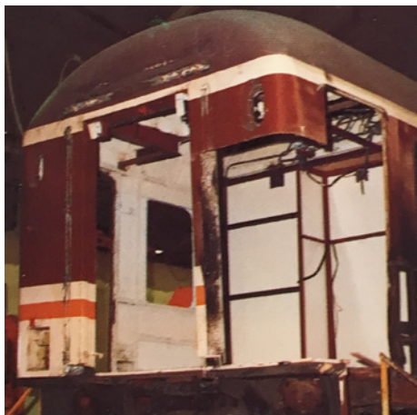
Proceso de reforma para la creación de los coches 16.200