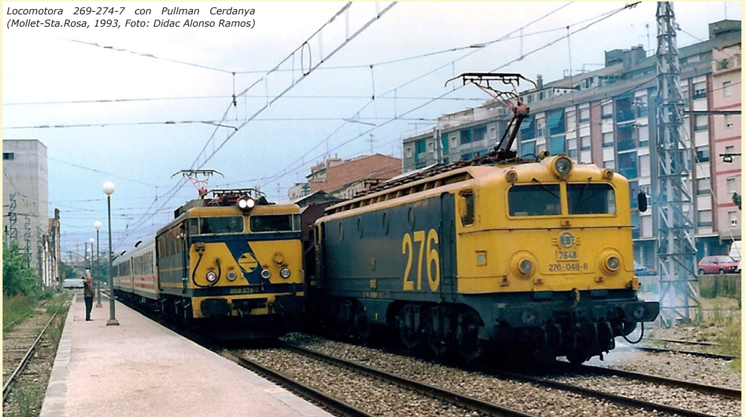
Locomotora 269-274-7 con Pullman Cerdanya (Mollet-Sta.Rosa, 1993,)