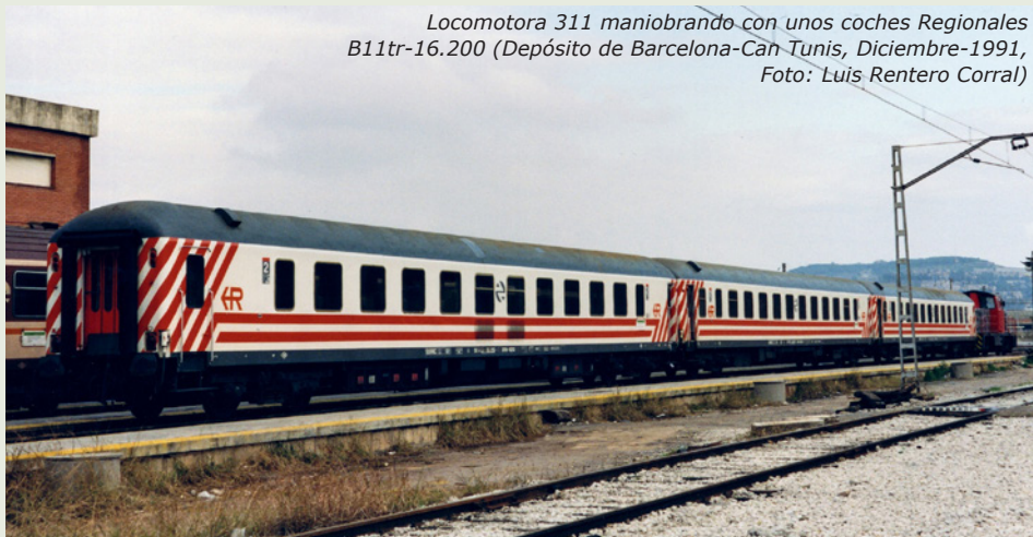
Locomotora 311 maniobrando con unos coches Regionales B11tr-16.200 (Depósito de Barcelona-Can Tunis, Diciembre-1991)

Se ha escrito mucho acerca de estos coches en diversos medios especializados, por ello que en este nuevo artículo del Club MFTrain se pretenden aclarar ciertas características de los 16.200, analizando cronológicamente su no muy larga vida con el fin de solventar posibles dudas que ayuden a la formación a escala 1:160 de composiciones lo más exactas posibles a la realidad, teniendo en cuenta los datos aportados a lo largo de las siguientes líneas.