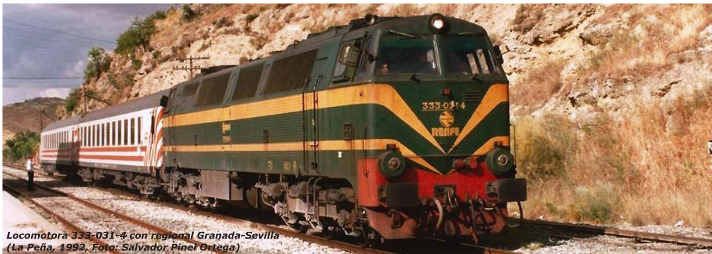
Locomotora 333-014 con regional Granada-Sevilla (La Peña, 1992, Foto: Salvador Pinel Ortega)