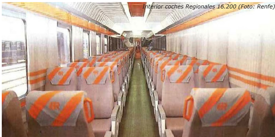
Interior coches Regionales 16.200

En el mes de marzo del año 1991 comienza la reforma de 40 coches de 2ª clase de la serie 8.500 de RENFE (8.501 a 8.792), todos ellos con ventanillas de 1x1m y departamentos. La idea era crear coches con un único departamento interior y pasillo central, con hileras de asientos de dos plazas, abatibles y orientables según sentido de la marcha, a lo largo de todo el interior del coche.