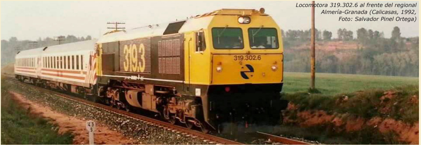
Locomotora 319.302.6 al frente del regional Almería-Granada (Calicasas, 1992,)