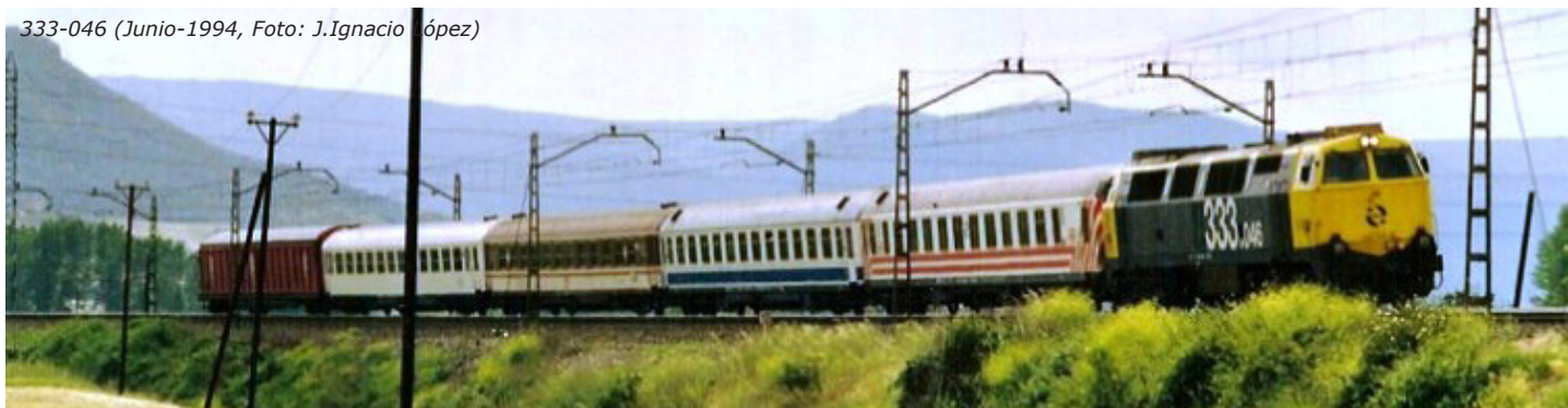
333-046 (Junio-1994)