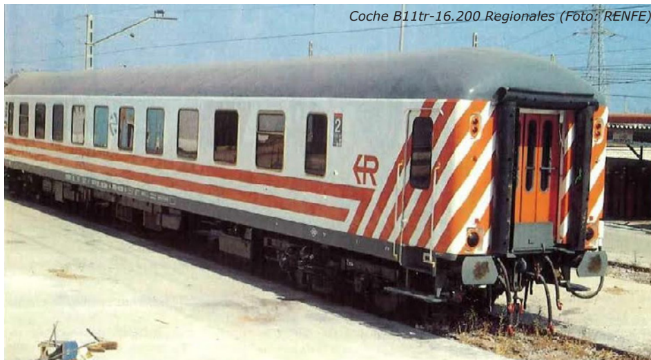
Coche B11tr-16.200 Regionales

El primer vehículo modificado salió en julio de 1991 (el 16.201) y el último (16.240) en marzo del siguiente año (1992).