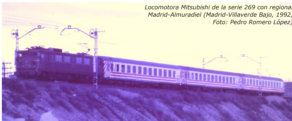
Locomotora Mitsubishi de la serie 269 con regional Madrid-Almuradiel (Madrid-Villaverde Bajo, 1992)