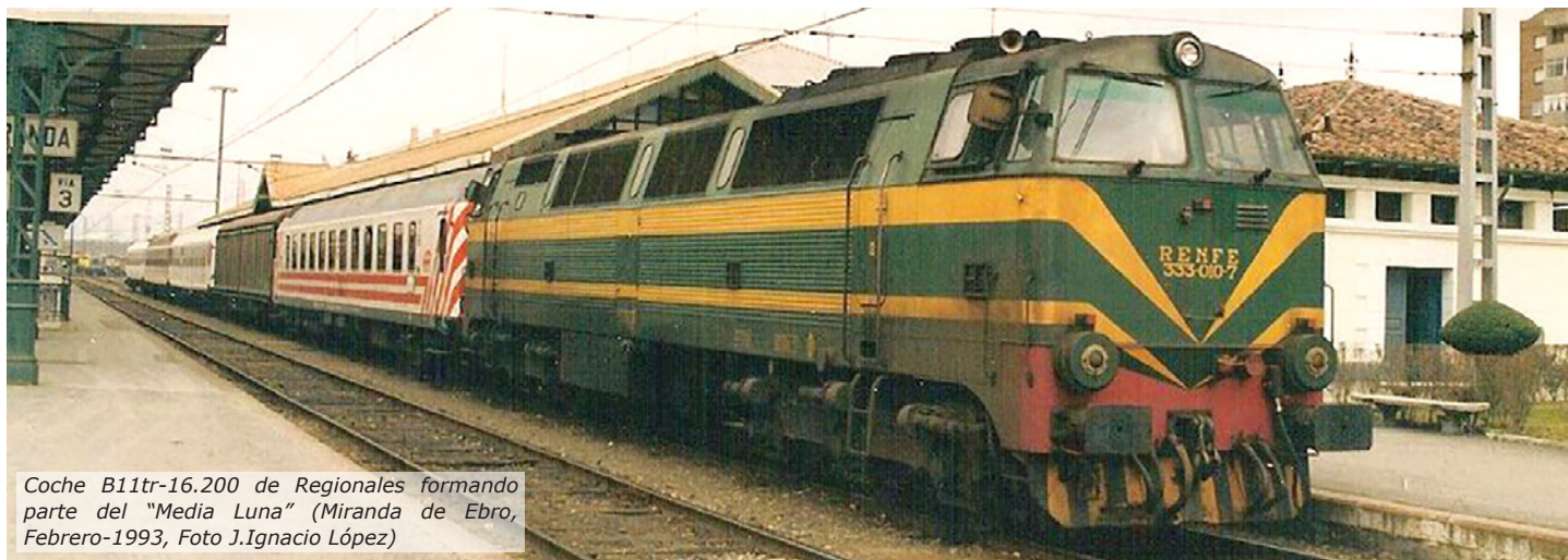
Coche B11tr-16.200 de Regionales formando parte del "Media Luna" (Miranda de Ebro, Febrero-1993)