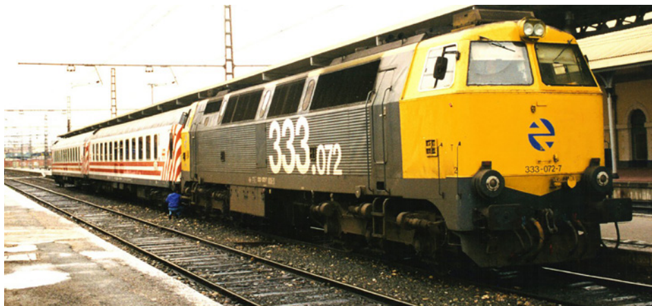
Foto drch. Locomotora 333-072-7 con el Iberia, formado por coches B11tr-16.200 (Miranda de Ebro, Noviembre-1994,)

Es importante destacar también la utilización de estos coches 16.200 (a modo de refuerzo, principalmente, aunque también formando composiciones puras) en trenes que no eran los propios de la UNE de Regionales, tales como el Estrella Costa Vasca, el Iberia o el Media Luna.