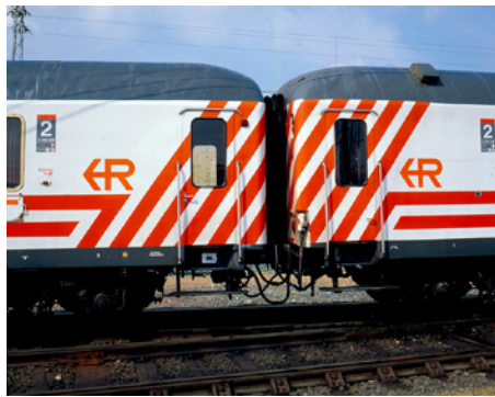
Coches Regionales de la serie 16.200 de RENFE

Es un hecho que los 16.200 Regionales parten de la base de los antiguos coches 8.000 de 2ª clase de RENFE (en concreto de la serie BB-8.500), si bien poco tienen que ver los unos con los otros, ya que la reforma que se realizó a partir del mes de marzo de 1991 en el Taller Central de Reparaciones de Málaga-Los Prados fue prácticamente integral (se conservaron únicamente los bogies Minden-Deutz y algunos elementos de la caja).