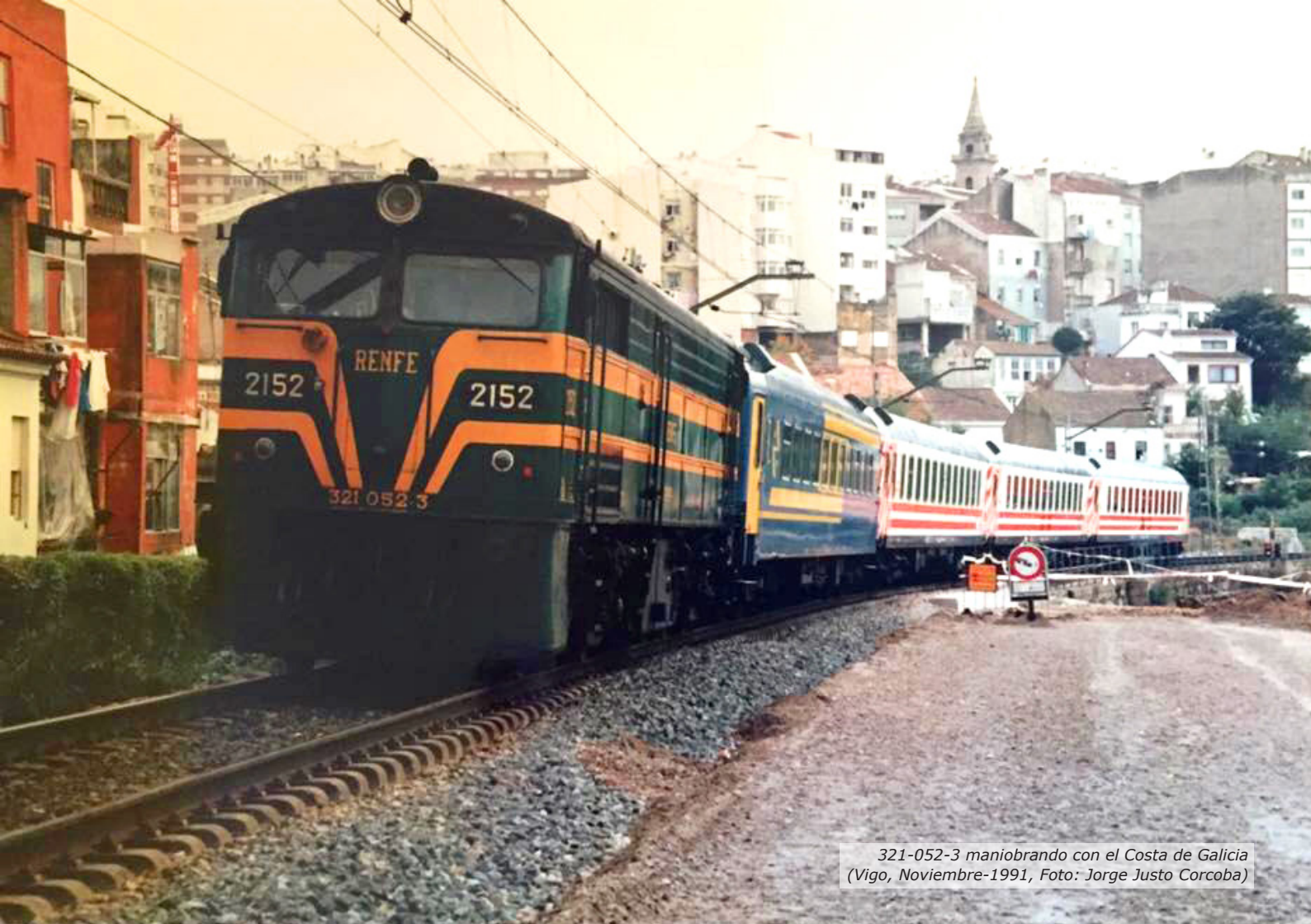
321-052-3 maniobrando con el Costa de Galicia (Vigo, Noviembre-1991,)