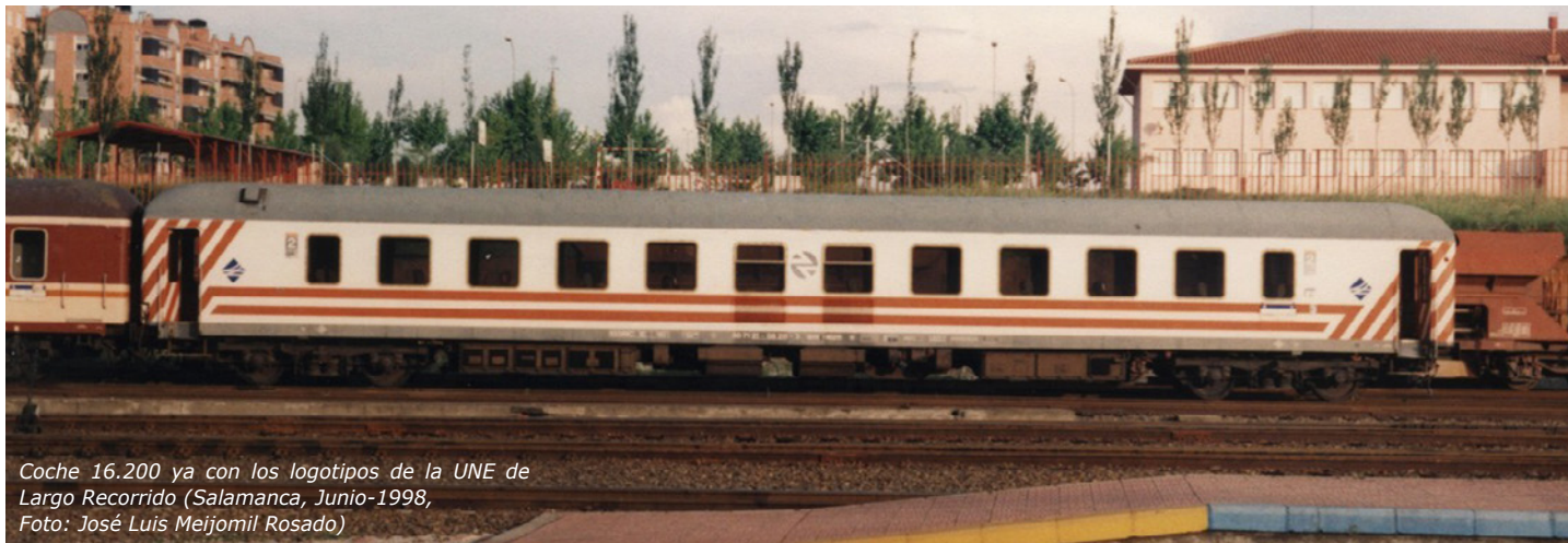
Coche 16.200 ya con los logotipos de la UNE de Largo Recorrido (Salamanca, Junio-1998, Foto: José Luis Meijomil Rosado)

El logotipo de rombo de la UNE de Largo Recorrido es aprobado y comienza a ser aplicado en alguno de esos 16.200 (no en todos), que ya habían sido pintados en librea "Danone", siguiente página.