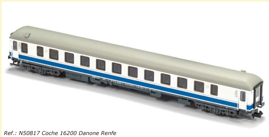
Ref.: N50817 Coche 16200 Danone Renfe

Esta versión Danone sin logotipos de Largo Recorrido es la reproducida a escala 1:160 bajo la referencia MFTrain N50817, referencia formada en este caso por un único coche, y como bien se acaba de comentar, puede incluirse perfectamente en composiciones junto con coches 16.200 con decoración Regionales original (MFTrain N71005)