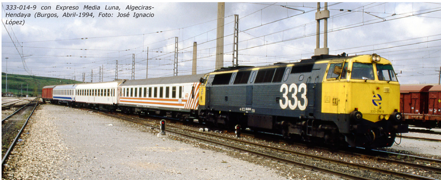
333-014-9 con Expreso Media Luna, Algeciras-Hendaya (Burgos, Abril-1994,)