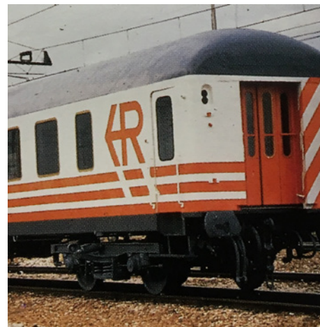
Foto derecha: Coche base utilizado como modelo de presentación. Se aprecian en el testero los dos esquemas de pintura de cada lateral

y pintado en la nave de pintura de Madrid-Fuencarral. En un lateral del mismo se presentaba una de las propuestas y por el otro lado del coche, la otra. Es decir, el coche tenía dos laterales con distintos esquemas de pintura que servirían para que RENFE pudiera decidir la decoración definitiva.