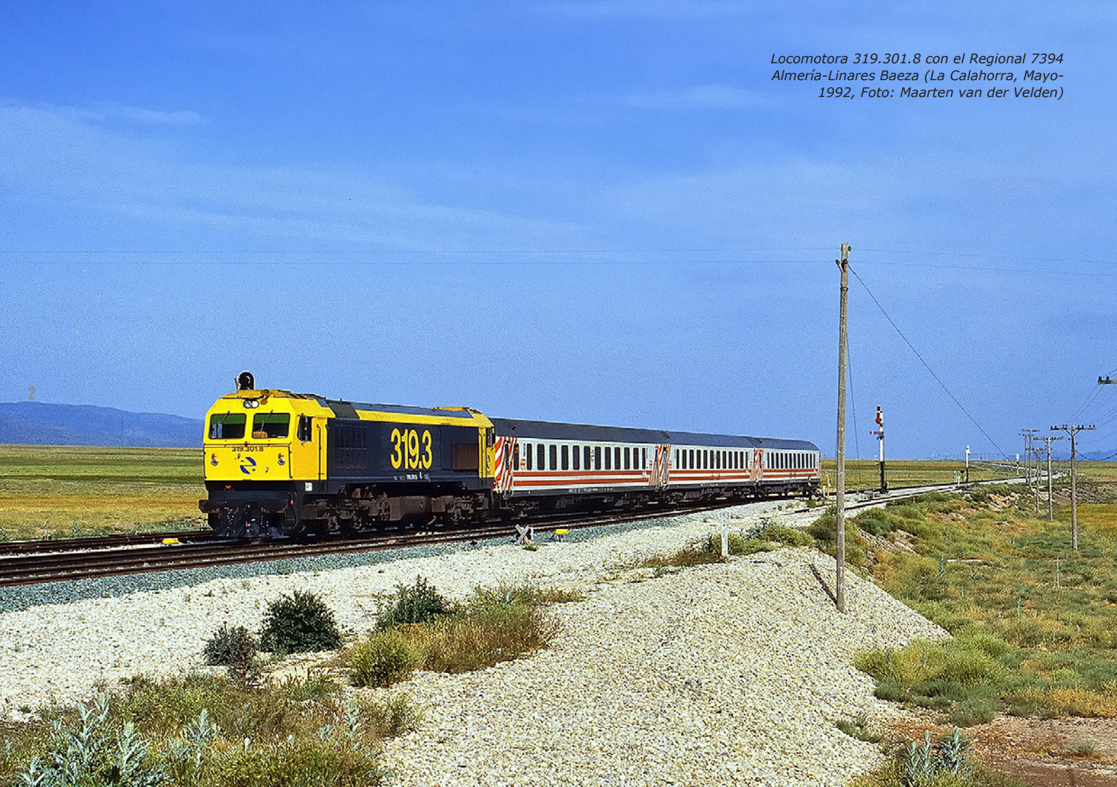
Locomotora 319.301.8 con el Regional 7394 Almería-Linares Baeza (La Calahorra, Mayo- 1992,)