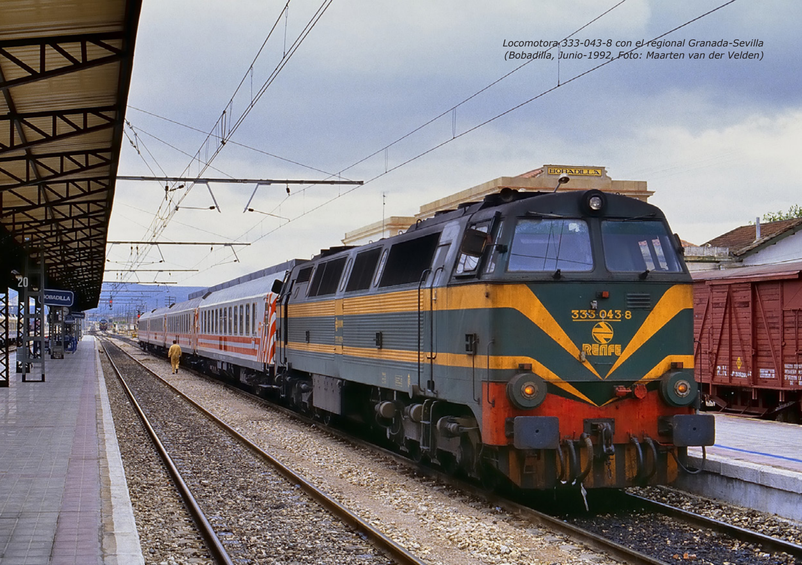
Locomotora 333-043-8 con el regional Granada-Sevilla (Bobadilla, Junio-1992,)