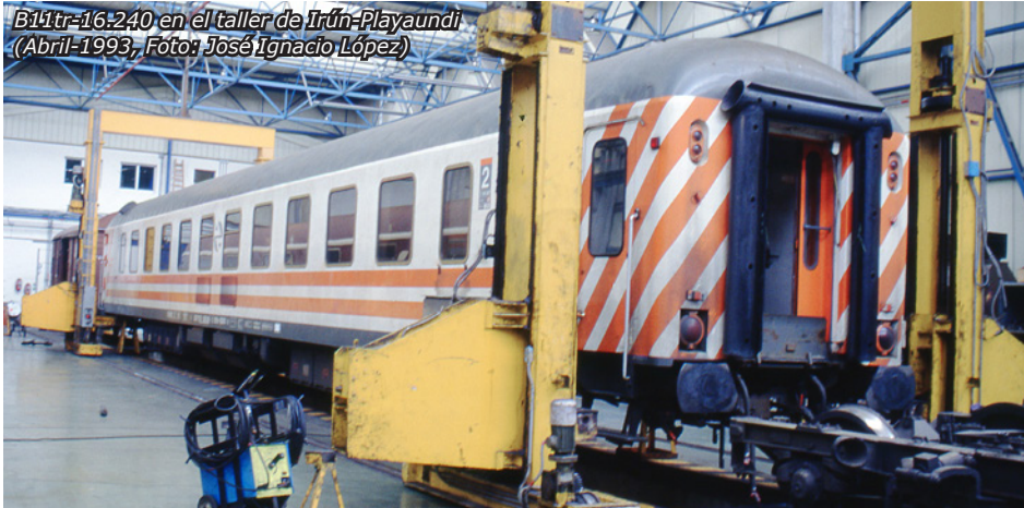
B11tr-16.240 en el taller de Irún-Playaundi (Abril-1993)

Antes se ha comentado la gran necesidad de los 16.200 en zonas de mucho calor. Pero prestaron también servicios (exclusivamente o junto a otro material, como se acaba de comentar) en otras partes de la geografía española. A modo de ejemplo, caben destacar los siguientes: