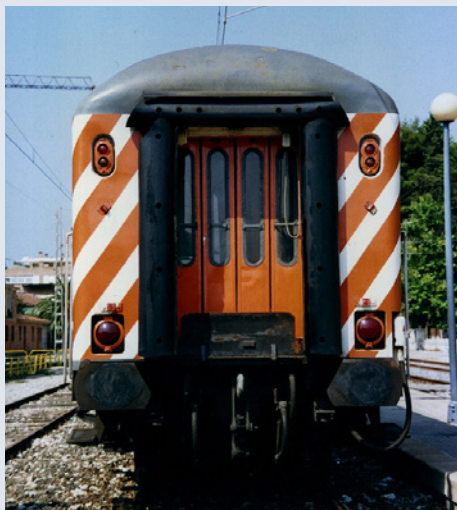
Detalle del testero del coche B11tr-16.211 (Salou, Julio-1995, Foto: Luis Rentero Corral)

Durante esta época, los coches circularon con bogies Minden-Deutz aptos para 120 km/h.