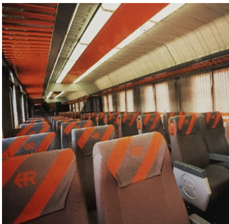
Interior coches Regionales 16.200

Todos los coches de esta serie disponían de un total de 88 plazas de 2ª Clase.