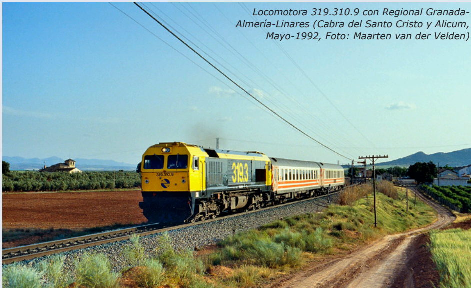
Locomotora 319.310.9 con Regional Granada-Almería-Linares (Cabra del Santo Cristo y Alicum, Mayo-1992,)