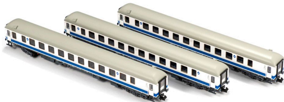
Foto superior. B11t-16.231 en decoración "Danone", bogies Minden-Deutz y logotipos de Largo Recorrido (Madrid-Fuencaral)