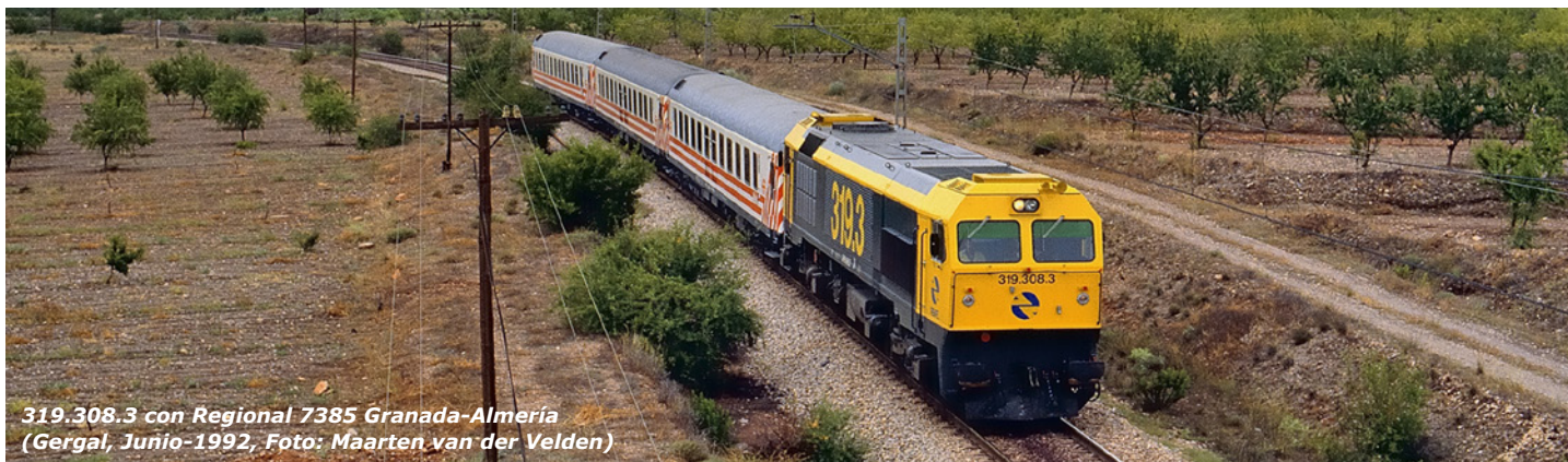
319.308.3 con Regional 7385 Granada-Almería (Gergal, Junio-1992,)