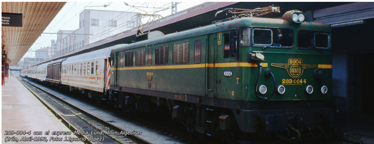
289-004-4 con el expreso Media Luna, Irún-Algeciras (Irún, Abril-1993,)