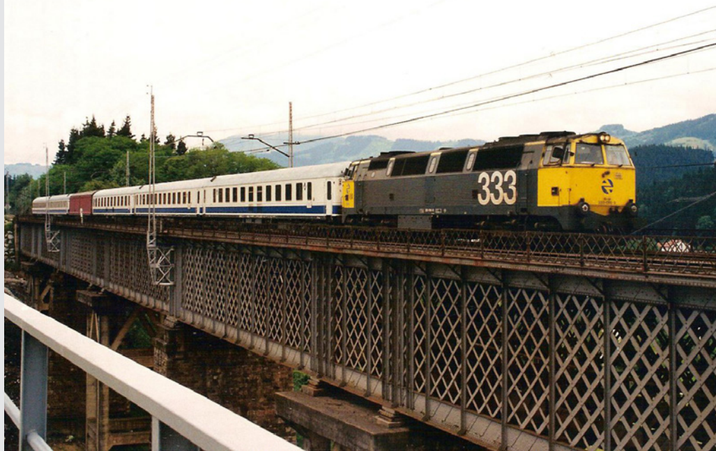
333-066-9 al frente del Iberia y el Media Luna, con dos B11t-16.200 tras la locomotora (Viaducto de Ormaiztegui, Junio-1995,)

Algunas de las composiciones destacables en las que formaron parte estos coches 16.200 "Danone" de Largo Recorrido con logotipos y bogies Minden-Deutz fueron, entre otros, el Iberia o el Media Luna principalmente.