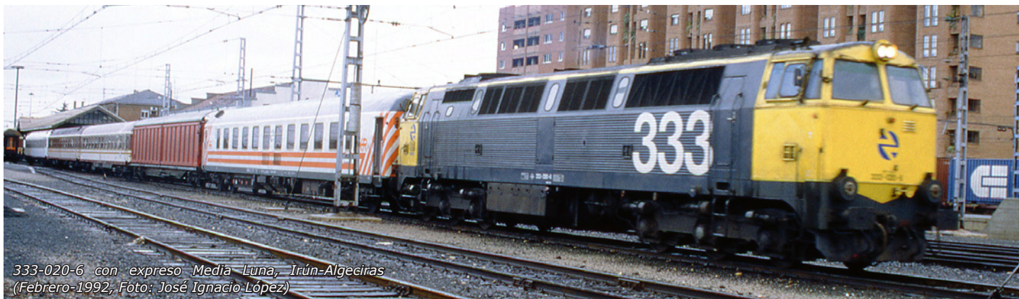
333-020-6 con expreso Media Luna, Irún-Algeciras (Febrero-1992,)