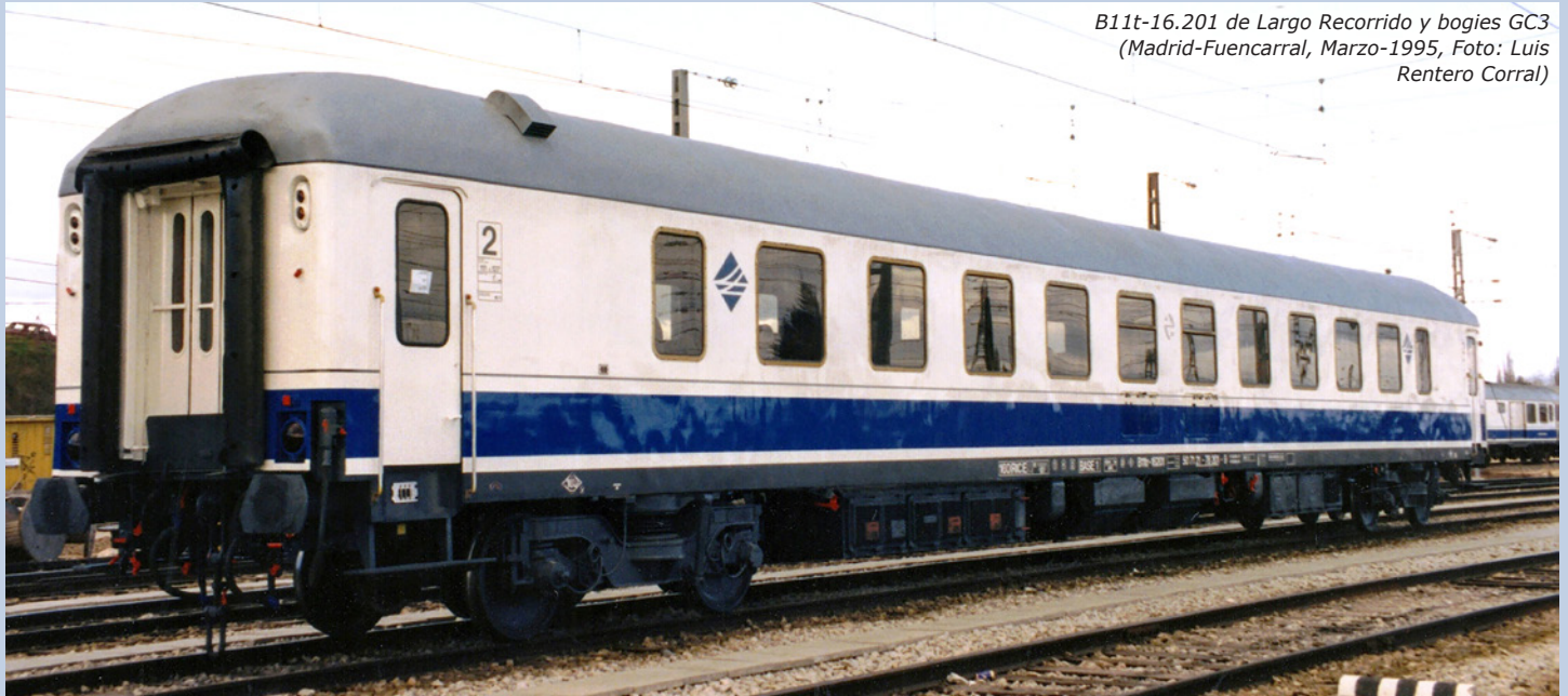
B11t-16.201 de Largo Recorrido y bogies GC3 (Madrid-Fuencarral, Marzo-1995)