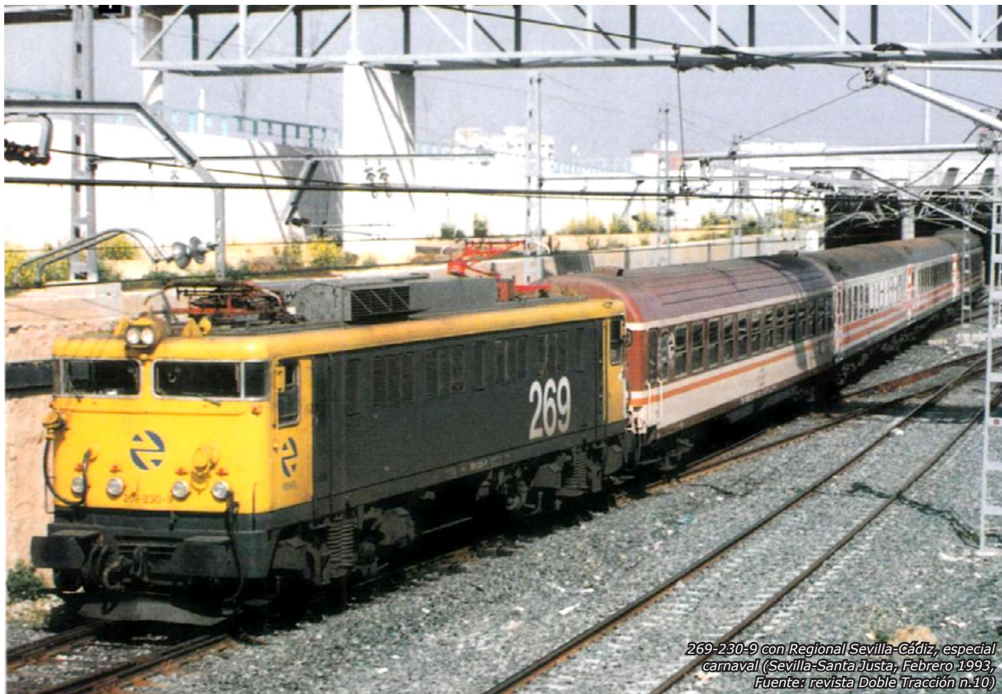
269-230-9 con Regional Sevilla-Cádiz, especial carnaval (Sevilla-Santa Justa, Febrero 1993, Fuente: revista Doble Tracción n.10)