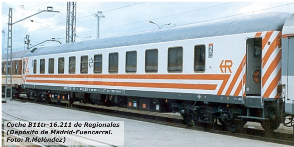
Coche B11tr-16.211 de Regionales (Depósito de Madrid-Fuencarral. Foto: R.Meléndez)