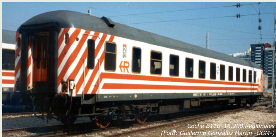
Coche B11tr-16.208 Regionales

Los coches de viajeros de la serie 16.200 de RENFE son uno de los materiales más conocidos dentro del parque de viajeros de RENFE. Esto es debido principalmente a la particular decoración blanca y naranja que recibieron de la U.N.E. de Regionales RENFE, y por ello que la mayoría de los aficionados los conocen y mencionan precisamente por el nombre de su decoración: los regionales.