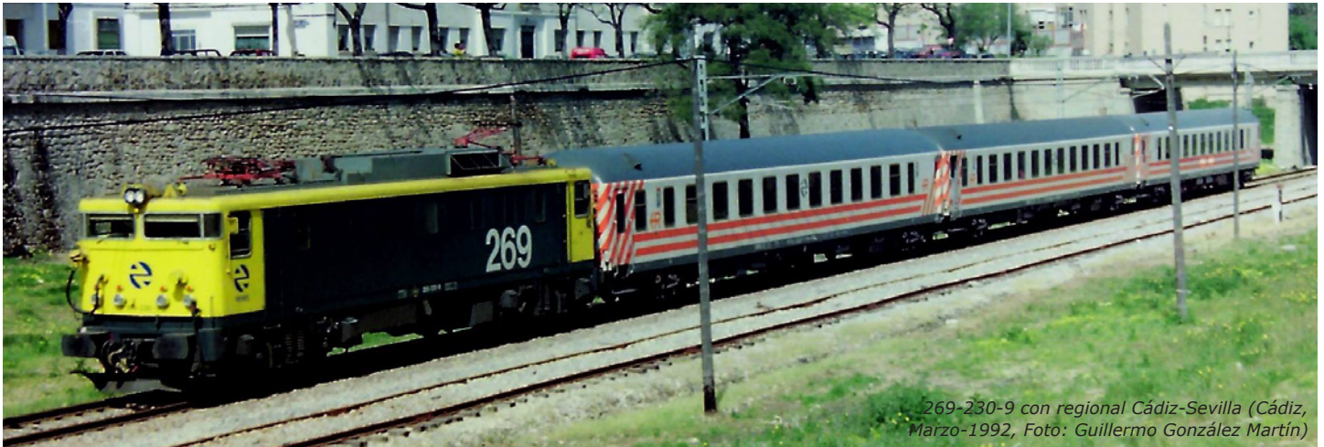
269-230-9 con regional Cádiz-Sevilla (Cádiz, Marzo-1992,)