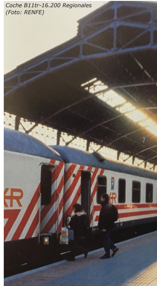
Coche B11tr-16.200 Regionales