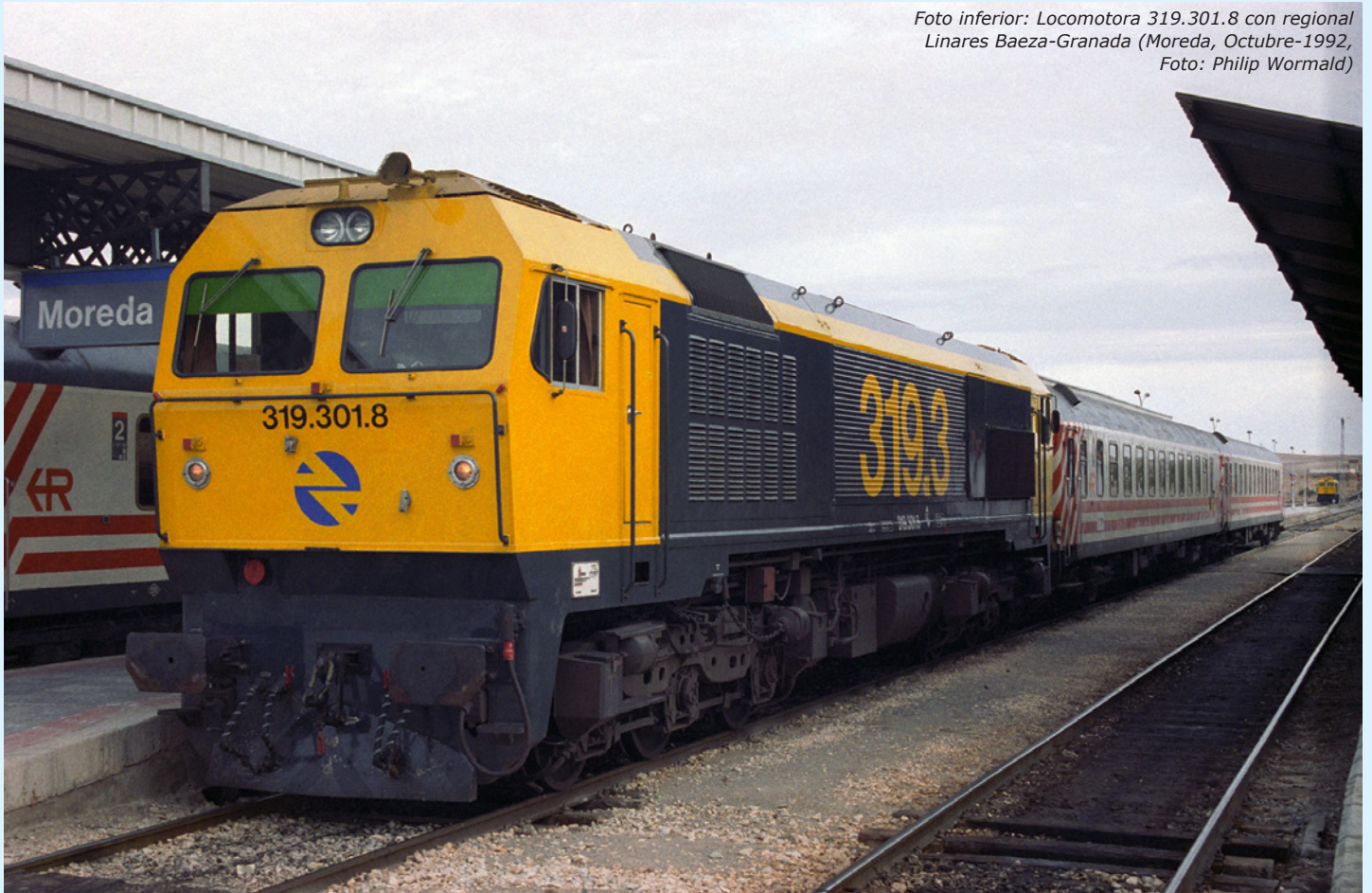
Foto inferior: Locomotora 319.301.8 con regional Linares Baeza-Granada (Moreda, Octubre-1992,)