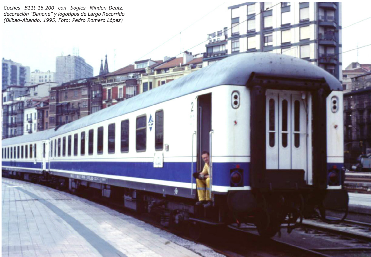
Coches B11t-16.200 con bogies Minden-Deutz, decoración "Danone" y logotipos de Largo Recorrido (Bilbao-Abando, 1995)