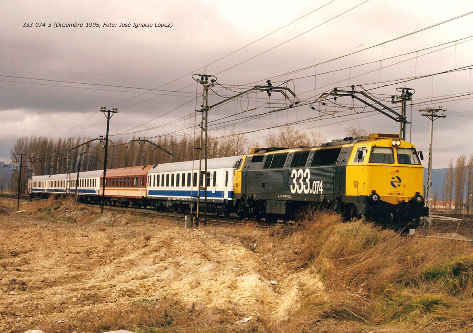
333-074-3 (Diciembre-1995,)