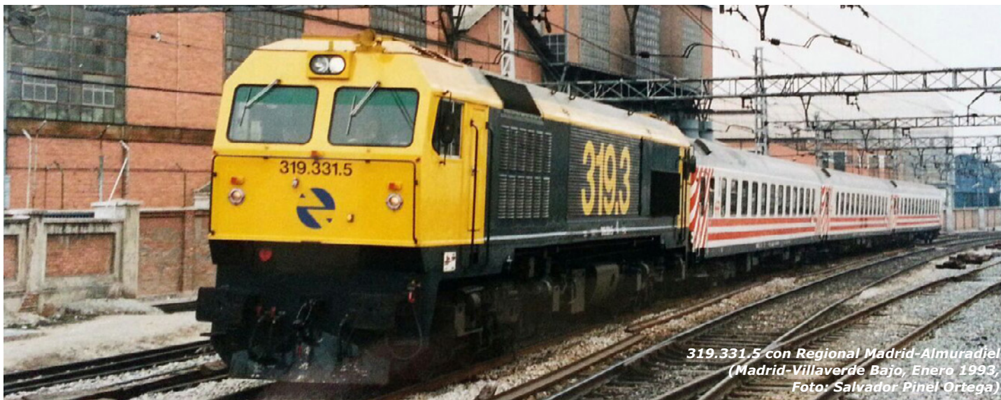
319.331.5 con Regional Madrid-Almuradiel (Madrid-Villaverde Bajo, Enero 1993,)