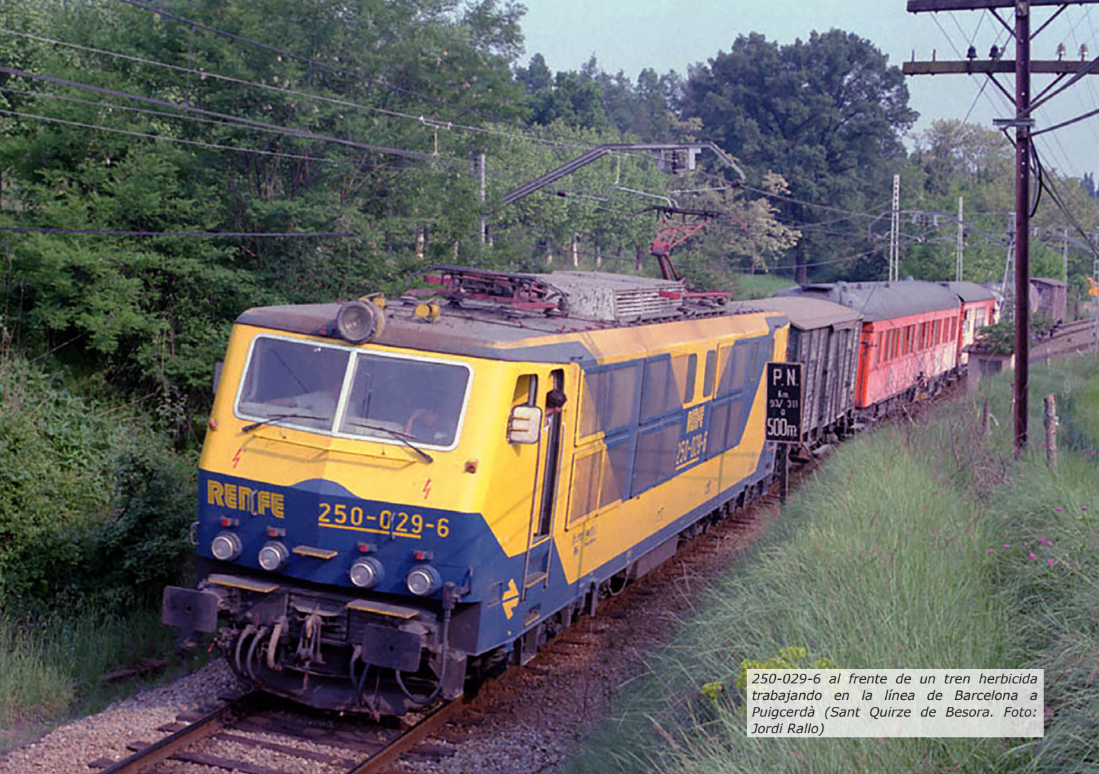
250-029-6 al frente de un tren herbicida trabajando en la línea de Barcelona a Puigcerdà (Sant Quirze de Besora.)