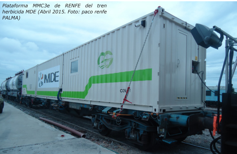
Plataforma MMC3e de RENFE del tren herbicida MDE (Abril 2015. Foto: paco renfe PALMA)