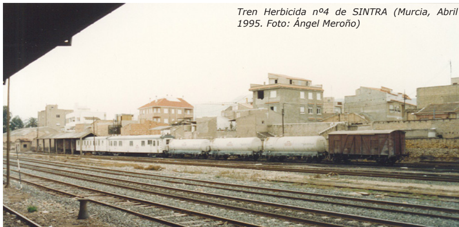
Tren Herbicida nº4 de SINTRA (Murcia, Abril 1995. Foto: Ángel Meroño)

Hasta la temporada de otoño del año 2014, SINTRA era la única empresa que tenía material ferroviario destinado a la labor de tren herbicida. SINTRA siempre había realizado las labores de limpieza de la vegetación cercana a las vías desde varias décadas atrás.