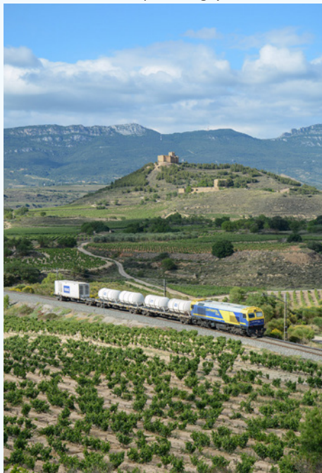
Foto inferior. Tren herbicida del grupo VIAS y Construcciones, con una locomotora 319.3 de Continental Rail al frente (San Asensio, Junio 2021. Foto: Javier López Ortega)

Por norma general, y salvo alguna excepción, las temporadas de trenes herbicidas suelen ser la primavera y el otoño, realizando siempre la función con el tren en movimiento.