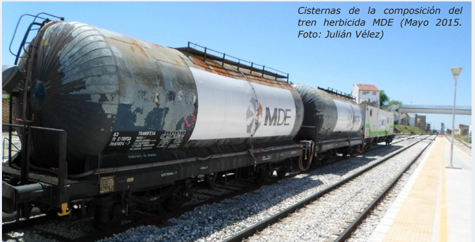
Cisternas de la composición del tren herbicida MDE (Mayo 2015. Foto: Julián Vélez)