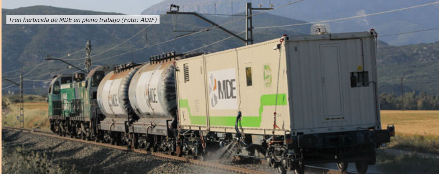
Tren herbicida de MDE en pleno trabajo

Acostumbrados, tal vez, a la longitud de algunos de los artículos ya publicados a lo largo de los diferentes números de nuestra revista del CLUB MFTrain, puede dar la sensación de que unos vehículos ferroviarios son más importantes que otros. La realidad dista mucho de esta idea. En muchas ocasiones es difícil conocer la larga historia de cierto material dada la variedad de versiones y