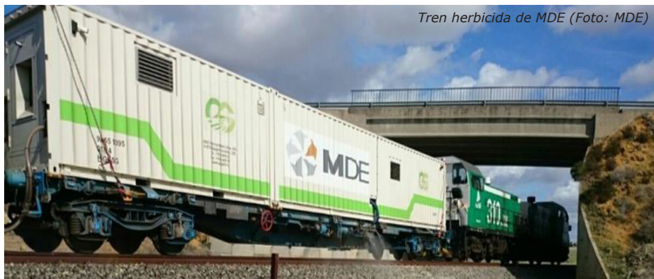
Tren herbicida de MDE

El principal objetivo del herbicida de MDE es, al igual que el del resto de los trenes herbicidas, mantener sin vegetación las zonas de banqueta y de transición. En lo que se refiere a los márgenes de la plataforma, los trabajos a realizar eran principalmente preventivos (apeos, talas, podas, desbroces y tratamientos herbicidas), con el objetivo de controlar la vegetación en las zonas de paseos y márgenes e instalaciones ferroviarias (estaciones, subestaciones, parques de telecomunicaciones, líneas de alta tensión, línea de fibra óptica...) para minimizar el riesgo de incendio y reducir al máximo los efectos negativos en la infraestructura ferroviaria y las instalaciones.