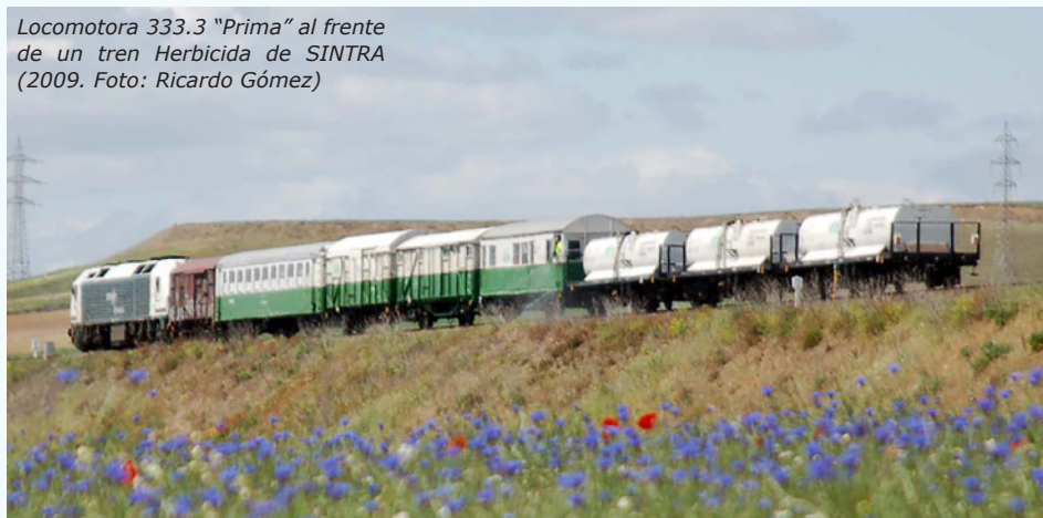
Locomotora 333.3 "Prima" al frente de un tren Herbicida de SINTRA (2009. Foto: Ricardo Gómez)

En la temporada de primavera del año 2015 es cuando ADIF decide abrir a concurso la licitación de los trenes herbicidas en las diferentes zonas ferroviarias de España. El concurso se dividía en varios lotes que coincidían con las zonas en las que está dividida la red convencional y varias empresas ganaron los distintos lotes. SINTRA continúa con sus trabajos, pero ya no es la única empresa encargada de realizar las labores de herbicida. Se unen en esta temporada de primavera