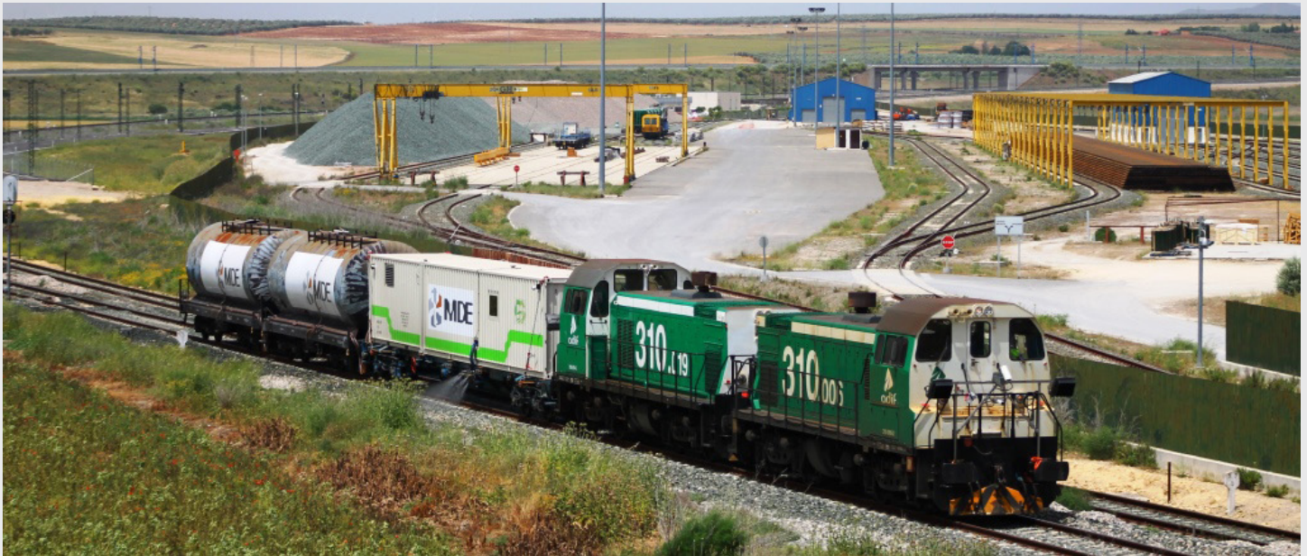
Foto inferior. 310-006-2 y 310-019 al frente del herbicida de MDE, en pleno trabajo

la masa vegetal de las inmediaciones de la vía como potencial combustible de fácil y rápida ignición.