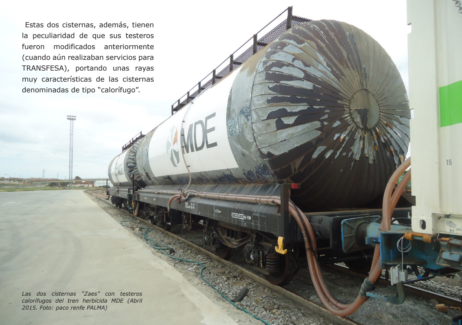
Las dos cisternas "Zaes" con testeros calorífugos del tren herbicida MDE (Abril 2015. Foto: paco renfe PALMA)

Estas dos cisternas, además, tienen la peculiaridad de que sus testeros fueron modificados anteriormente (cuando aún realizaban servicios para TRANSFESA), portando unas rayas muy características de las cisternas denominadas de tipo "calorífugo".