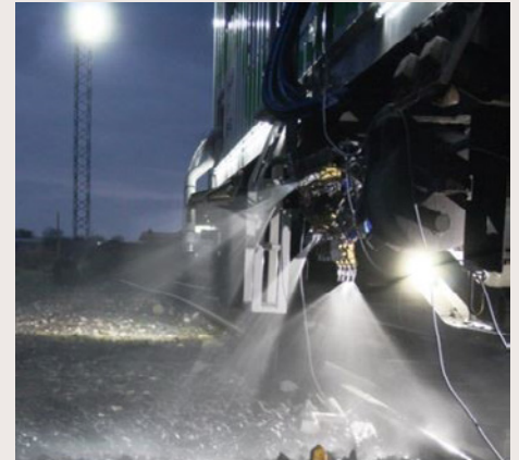
Fotos superiores. Pulverización del producto químico en el tren herbicida MDE