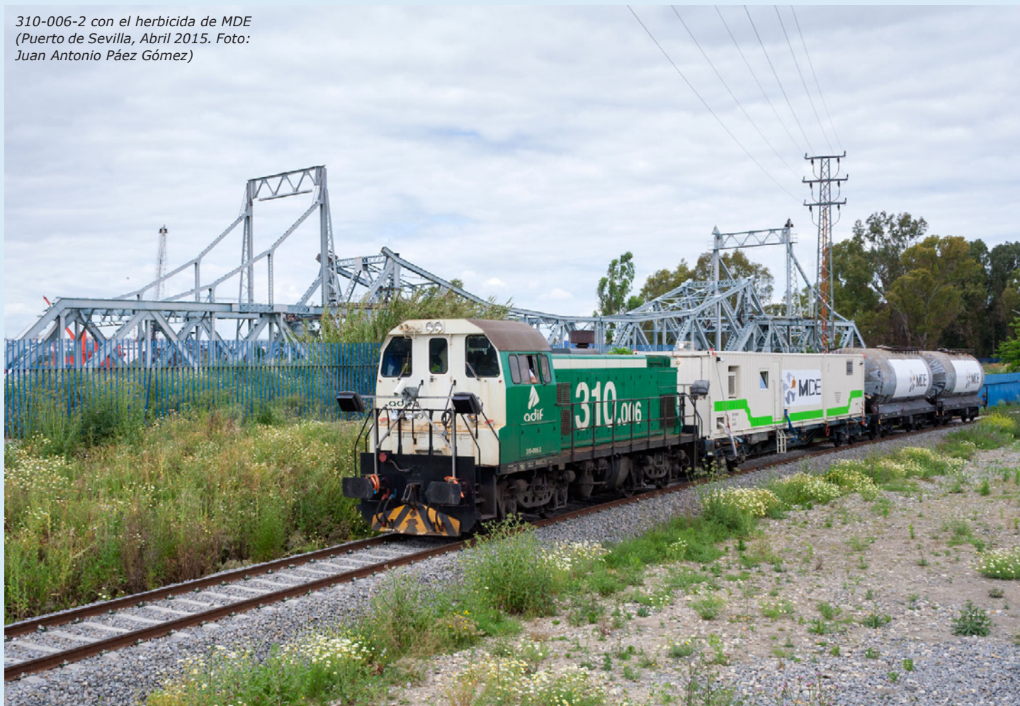
310-006-2 con el herbicida de MDE (Puerto de Sevilla, Abril 2015.)