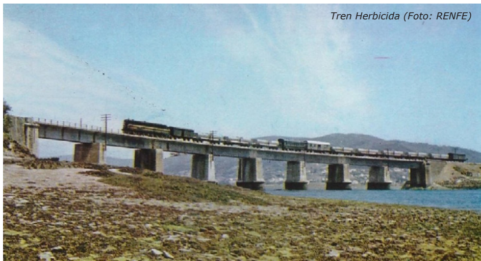
Tren Herbicida

Como acabamos de comentar, SINTRA fue la empresa que se dedicaba hasta la temporada del 2014 al mantenimiento de las vías en relación con la vegetación, disponiendo de varias ramas de trenes herbicidas esparcidas por diversas bases dentro de cada una de las zonas de RENFE.