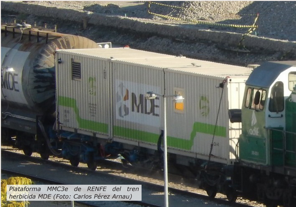
Plataforma MMC3e de RENFE del tren herbicida MDE

Esta plataforma portaba los contenedores (con logotipos y decoración de MDE) que albergaban una sala de control y motores para pulverizar y dispersar el producto químico.