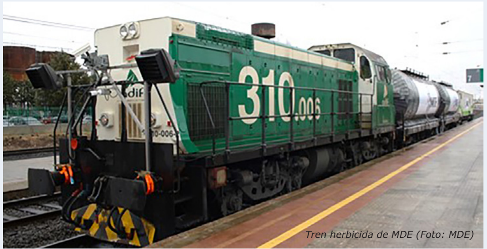
Tren herbicida de MDE