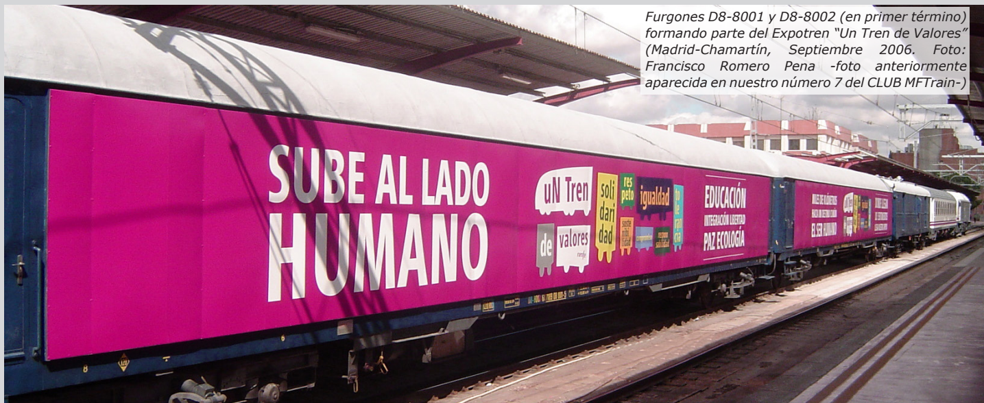
Furgones D8-8001 y D8-8002 (en primer término) formando parte del Expotren "Un Tren de Valores" (Madrid-Chamartín, Septiembre 2006. Foto: Francisco Romero Pena -foto anteriormente aparecida en nuestro número 7 del CLUB MFTrain-)