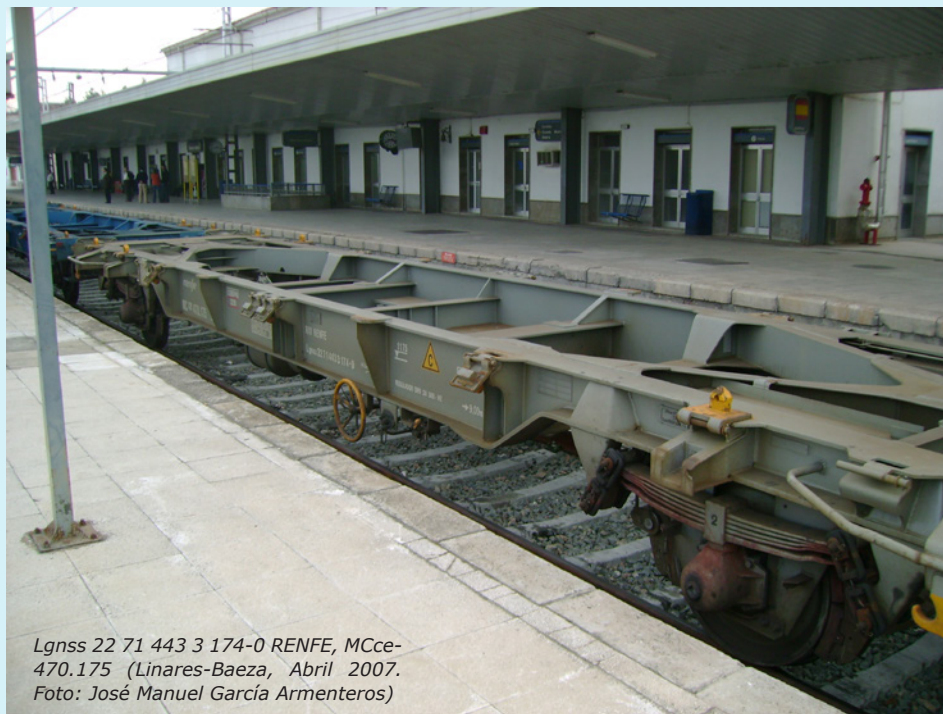
Lgnss 22 71 443 3 174-0 RENFE, MCce-470.175 (Linares-Baeza, Abril 2007.)

Se trata de una de las plataformas utilizadas en el “Tren de Valores” (en concreto la MC3 con matrícula MCce-470.175 y que portaba el contenedor de “Ayuda en Acción”), todavía en la decoración gris que se usó en ese tren y formando parte de una composición de plataformas portacontenedores de RENFE vacías junto a otras plataformas de dos ejes también de RENFE.