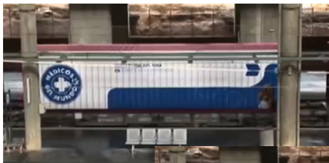
Plataforma tipo MC-3, MCce-470.676 con contenedor de "Médicos del Mundo" (Madrid-Atocha, Septiembre 2006.)

-Lgnss 22 71 443 3 001-5 RENFE MCce-470.002 (tipo MCI), con contenedor de 40' de "CRUZ ROJA".