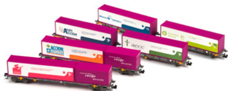
Set Un Tren de Valores N71004. 1º Set