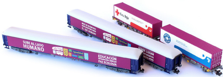
Set Un Tren de Valores N71027. 2º Set