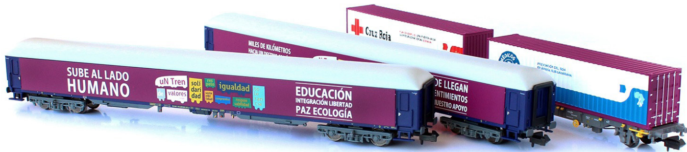
N71027. EXPOTREN "UN TREN DE VALORES", 2ª PARTE

de Valores". Dicha lectura servirá de referencia para poner en contexto las líneas que componen este pequeño dossier dedicado al nuevo set MFTTrain N71027.