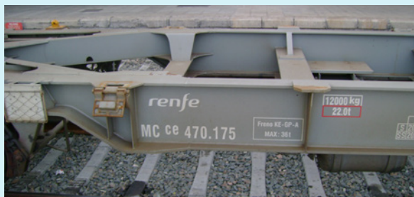
Foto drch. Lgnss 22 71 443 3 174-0 RENFE, MCce-470.175 (Linares-Baeza, Abril 2007.)