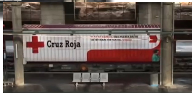
Plataforma tipo MC-I, MCce-470.002 con contenedor de Cruz Roja (Madrid-Atocha, Septiembre 2006. Foto: captura vídeo "Renfe: Un tren de valores, solidaridad y concienciación (II)")