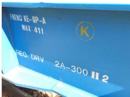
Foto izq. Todavía se pueden observar las letras de INTERCONTAINER bajo la pintura azul de esta plataforma Lgnss 22 71 443 9 924-2 E-RENFE, Mcc-480.924 (Madrid-Santa Catalina, Octubre 2019.)