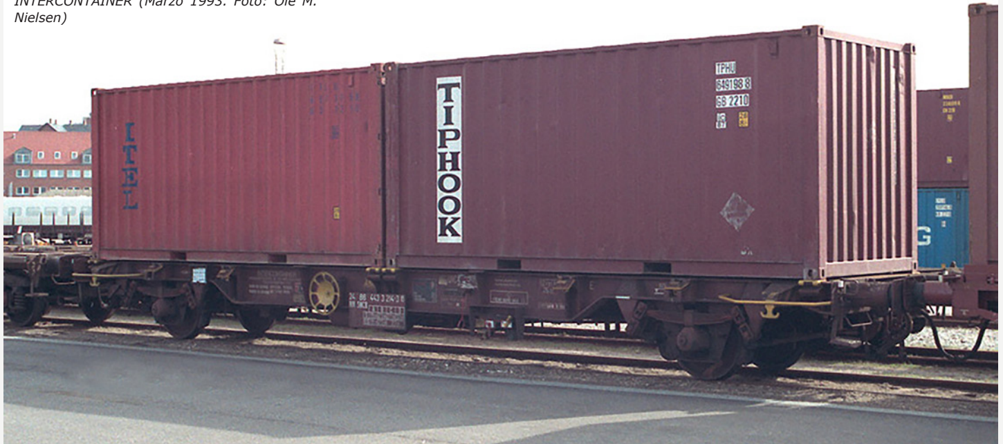
Plataforma Lgns 24 88 4433 214-3 SNCB de INTERCONTAINER (Marzo 1993.)