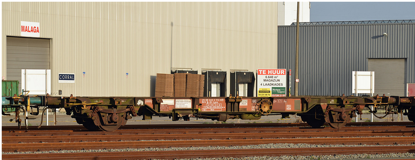
Foto inferior. Plataforma Lgns 25 88 4432 112-9 B-CARGO (Anwerpen.)