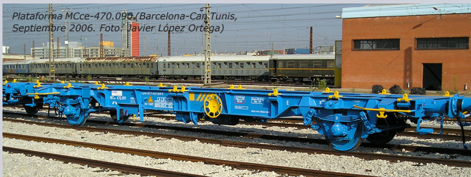
Plataforma MCce-470.090 (Barcelona-Car. Tunis, Septiembre 2006. Foto: Javier López Ortega)

Lgnss 22 71 443 9 800 a 999 , matrículas nacionales MC-480.800 a 480.999