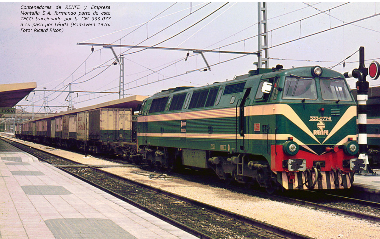
Contenedores de RENFE y Empresa Montaña S.A. formando parte de este TECO traccionado por la GM 333-077 a su paso por Lérida (Primavera 1976. Foto: Ricard Ricón)