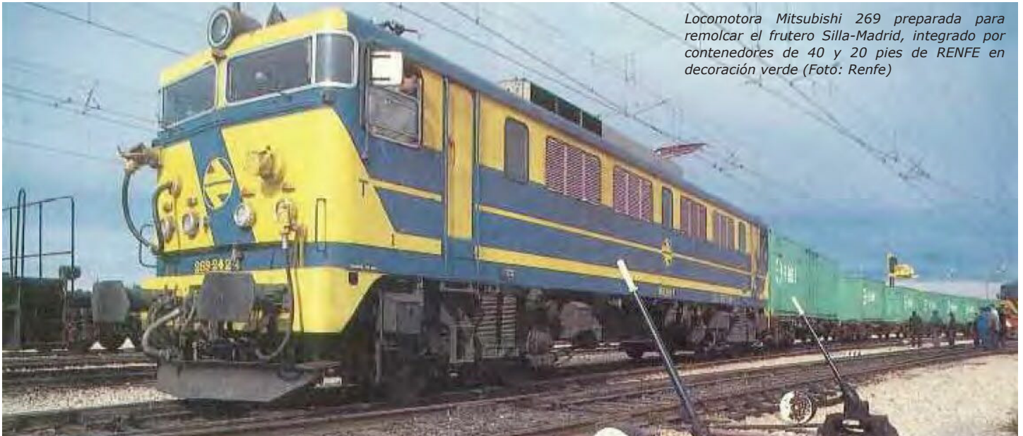
Locomotora Mitsubishi 269 preparada para remolcar el frutero Silla-Madrid, integrado por contenedores de 40 y 20 pies de RENFE en decoración verde