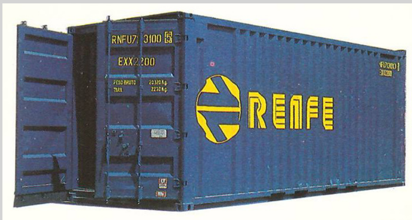
Foto izq. Contenedor RENFE Azul con galleta amarilla y letras típicas de época IV