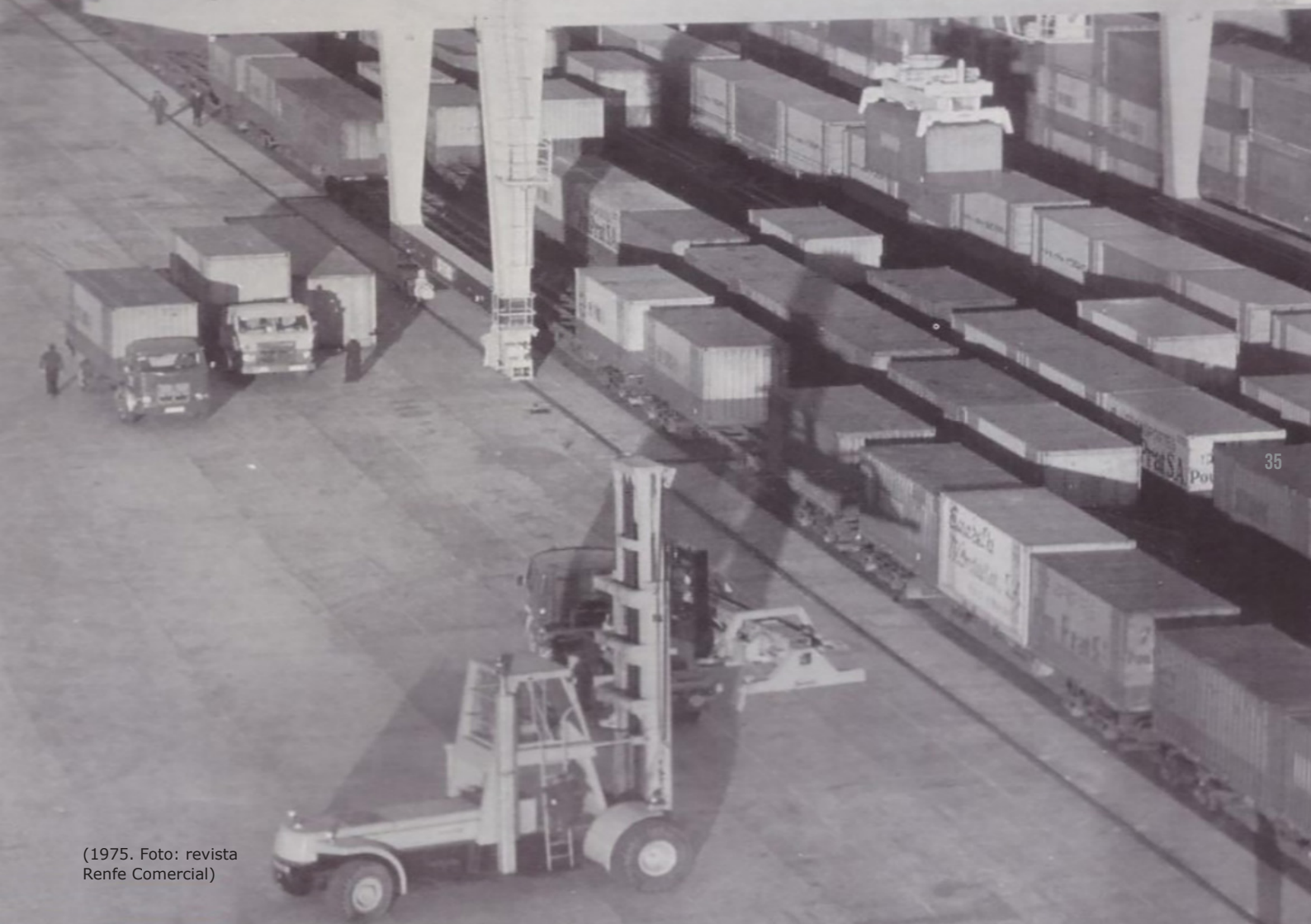
(1975. Foto: revista Renfe Comercial)