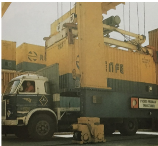
Foto superior izq. Contenedores de RENEFE, POSADAS, Transportes España y Pou-Prat (Foto: Renfe)

Foto superior drch. Contenedores de 20 pies de PULEVA (Foto: Renfe)