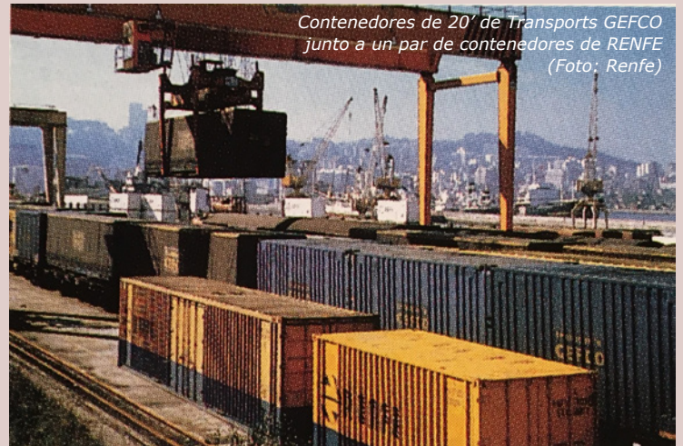
Contenedores de 20' de Transports GEFCO junto a un par de contenedores de RENFE