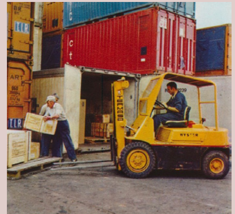
Foto superior: Contenedor Cti de 20'