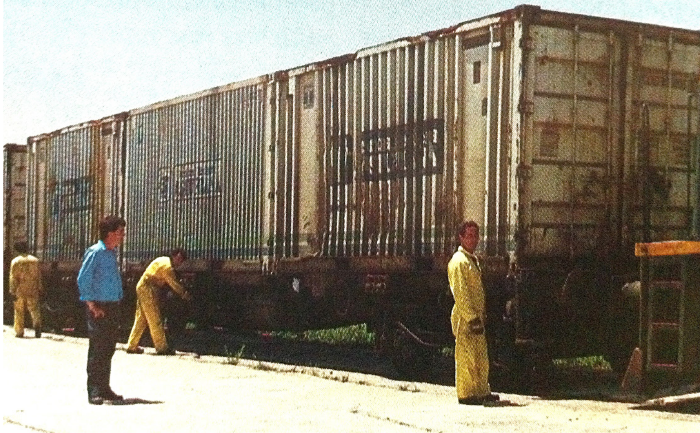
Contenedores de 20 pies de Central Lechera Asturiana, ya con logotipo de CLA