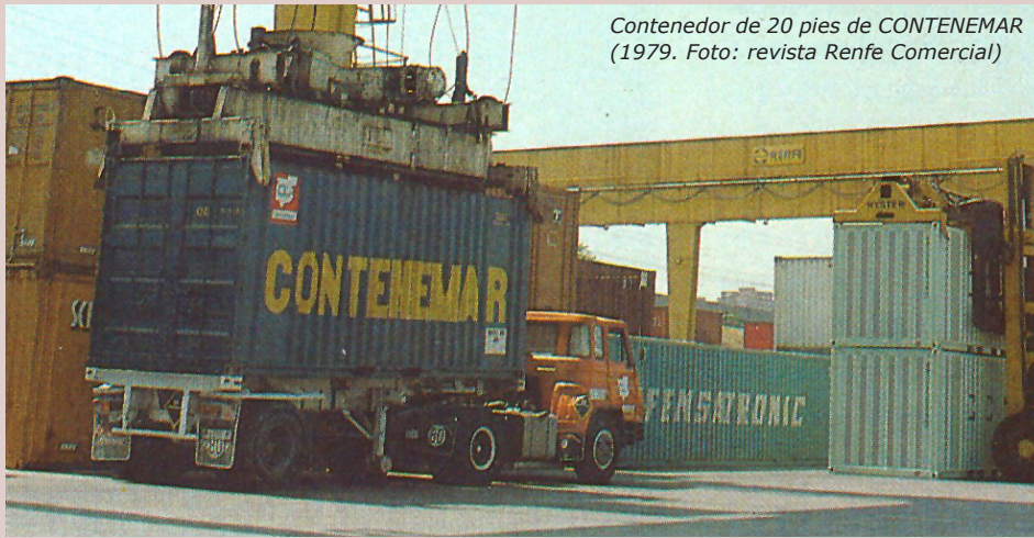
Contenedor de 20 pies de CONTENEMAR (1979. Foto: revista Renfe Comercial)