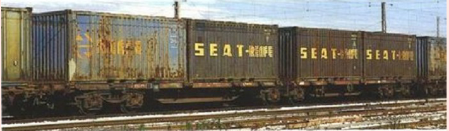
Foto superior. Contenedores de 20' SEAT-RENFE 17 y RENFE azul con galleta amarilla