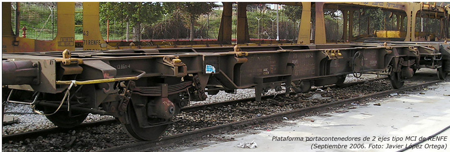
Plataforma portacontenedores de 2 ejes tipo MCI de RENFE (Septiembre 2006. Foto: Javier López Ortega)