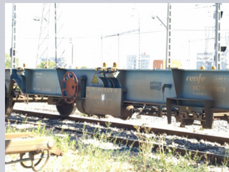
Foto superior. Detalle de la plataforma Lgnss 22 71 443 9 878-0 ex. INTERCONTAINER, con matrícula nacional RENFE MCce-480.878 (Madrid-Vicálvaro clasificación, Septiembre 2019.)