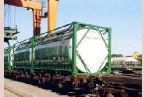
Foto drch. Plataforma MCI cargada con dos contenedores de 20 pies CONCISA de líquidos alimenticios

distintas plataformas del tipo MCI existentes. De este modo, esperamos que el aficionado pueda tener una información clara del porqué de cada matrícula y versión en función del momento en el que nos encontremos.