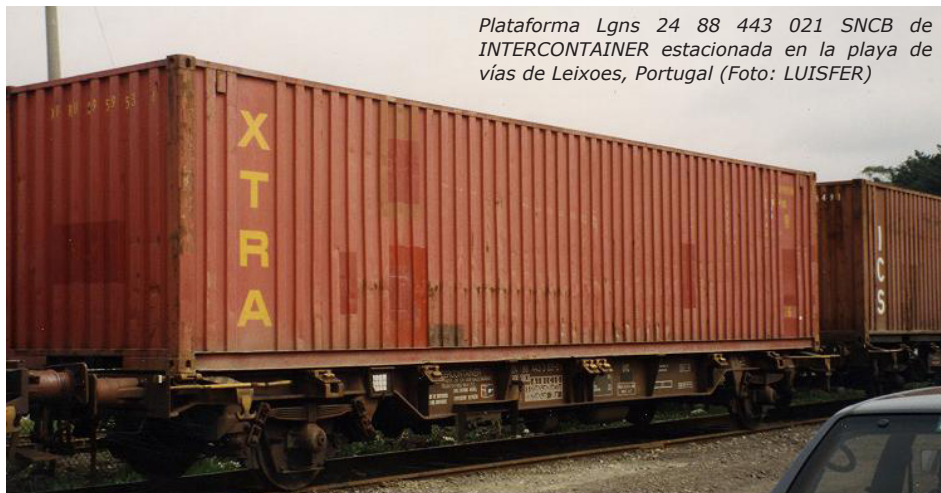
Plataforma Lgns 24 88 443 021 SNCB de INTERCONTAINER estacionada en la playa de vías de Leixoes, Portugal

Lgns 24 88 443 3 000 a 259 SNCB de INTERCONTAINER.