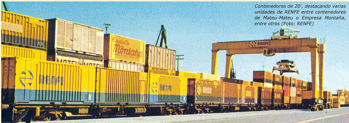
Contenedores de 20', destacando varias unidades de RENFE entre contenedores de Mateu-Mateu o Empresa Montaña, entre otros