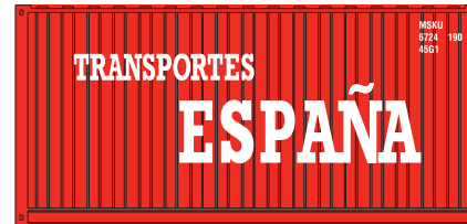
Contenedor Transportes ESPAÑA de 20 pies Diseño del contenedor 20' Transportes España