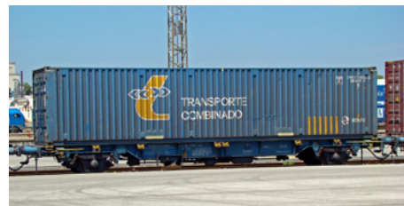
Plataforma tipo MCI de INTERCONTAINER y matrícula RENFE fotografiada en la terminal valenciana de Silla (Agosto 2009. Foto: J.C. Sevillano)