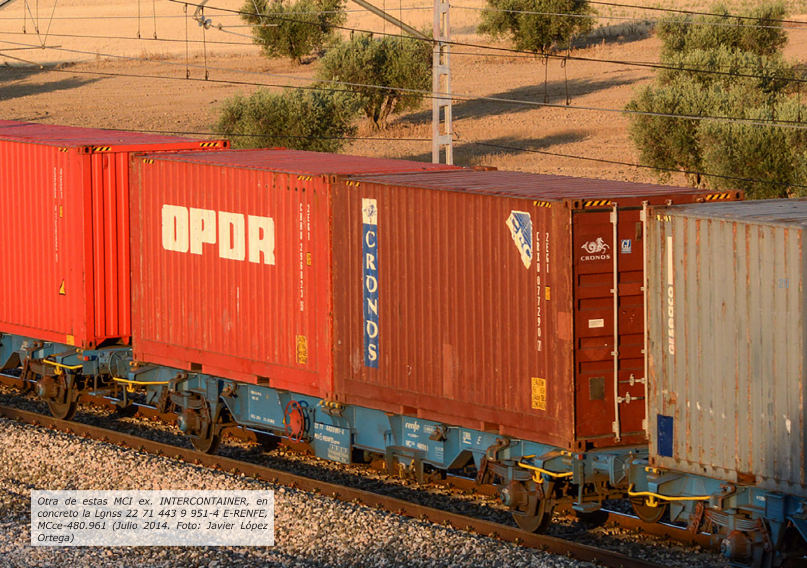
Otra de estas MCI ex. INTERCONTAINER, en concreto la Lgnss 22 71 443 9 951-4 E-RENFE, MCce-480.961 (Julio 2014.)