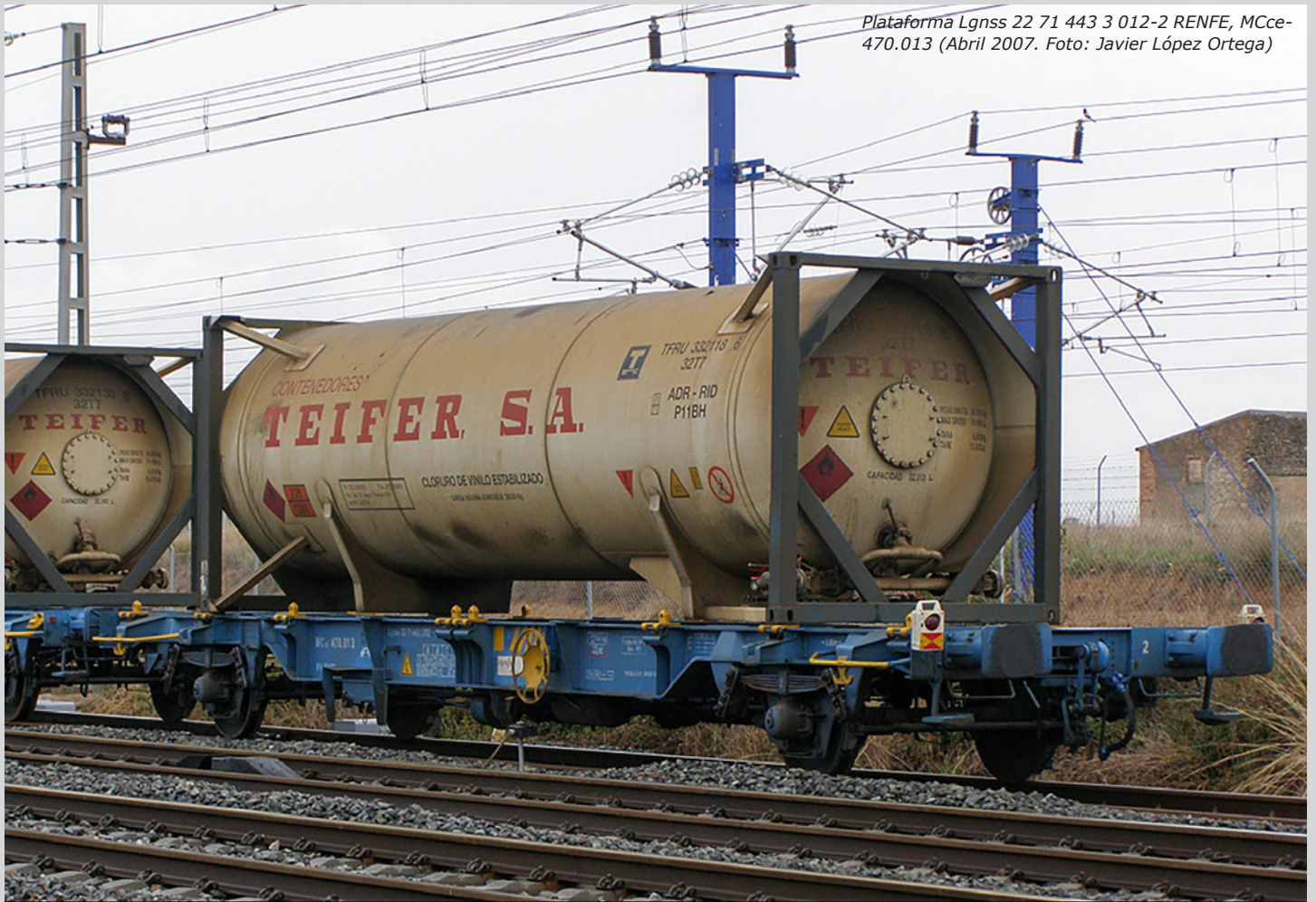
Plataforma Lgnss 22 71 443 3 012-2 RENFE, MCce-470.013 (Abril 2007.)