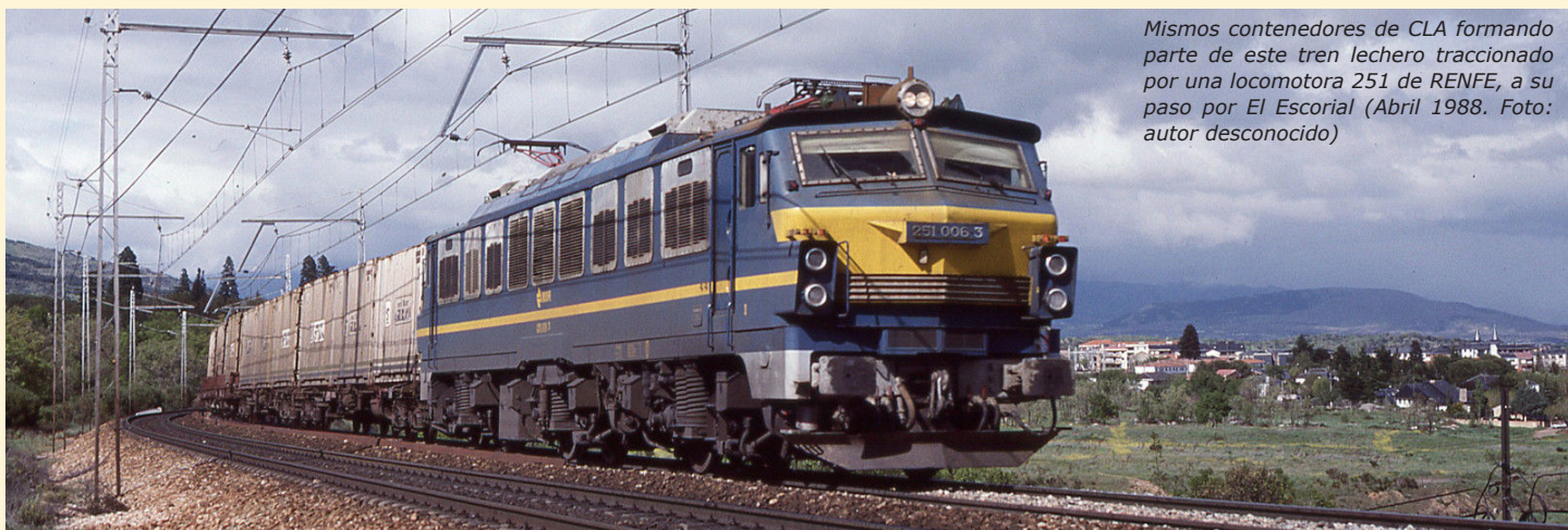
Mismos contenedores de CLA formando parte de este tren lechero traccionado por una locomotora 251 de RENFE, a su paso por El Escorial (Abril 1988. Foto: autor desconocido)