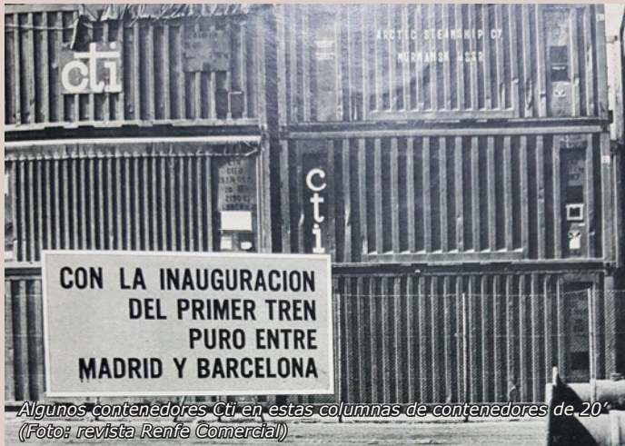
Algunos contenedores Cti en estas columnas de contenedores de 20'