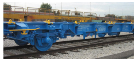
Plataforma MCI de INTERCONTAINER matriculada en RENFE

Sin embargo, las 100 MCI de RENFE que poseen además matrícula nacional MC-470.001 a 470.100 aparecen en dicho catálogo de Renfe en el cuadro de las MC-3, por lo dicho anteriormente: por ser MC-470.000 al igual que las MC-3 (aunque presenten algunas diferencias estéticas en su exterior -explicadas en el número 21 de nuestra revista del CLUB MFTrain)