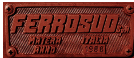
Detalle de la placa del fabricante FERROSUD SpA de la Lgnss 22 71 4439 852-5 RENFE, MCC 480.852

El encargo de INTERCONTAINER fue de 260 unidades, que quedaron