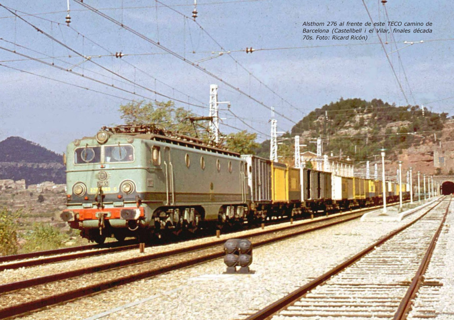
Alstom 276 al frente de este TECO camino de Barcelona (Castellbell i el Vilar, finales década 70s. Foto: Ricard Ricón)