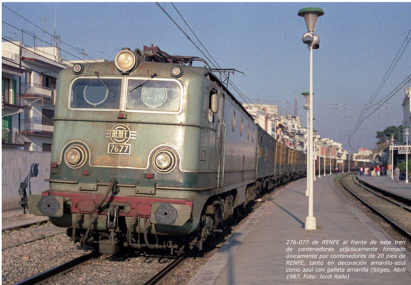
276-077 de RENFE al frente de este tren de contenedores prácticamente formado únicamente por contenedores de 20 pies de RENFE, tanto en decoración amarillo-azul como azul con galleta amarilla (Sitges, Abril 1987. Foto: Jordi Rallo)