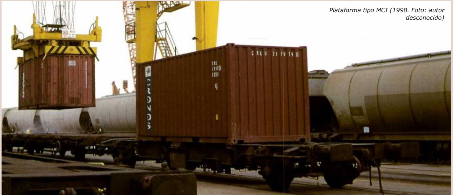
Plataforma tipo MCI (1998. Foto: autor desconocido)