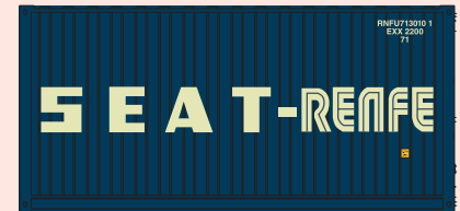
Foto inferior. Contenedores SEAT-RENFE ya en desuso