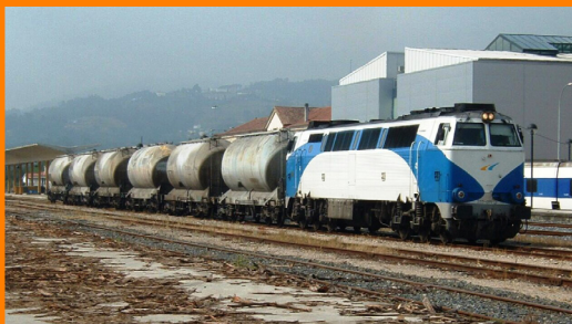
333 Grandes Líneas con pequeño corte de tolvas cementeras. Pontevedra Mayo 2004.