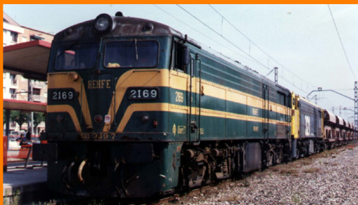
Dos Alco de la serie 321 se colocan al frente de este corte de tolvas balasteras en la estación de Granollers -Centro (principios de los años 90. Foto: Andrés Alba Rabaza. Fuente: Grupo Facebook "El Colector")