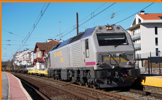
Locomotora diésel 333-319-2 al frente de un TECO de Continental Rail (Izarra, Marzo-2016,)